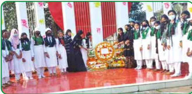
শিবপুর নরসিংদী জেলায় আন্তর্জাতিক মাতৃভাষা দিবস পালন

আন্তর্জাতিক মাতৃভাষা দিবস পালন : ২১ ফেব্রুয়ারি ঢাকা অঞ্চলের ১৩টি জেলায় আন্তর্জাতিক মাতৃভাষা দিবস পালন করা হয়।