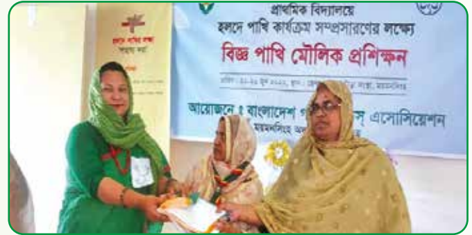
বিজ্ঞ পাখি মৌলিক প্রশিক্ষণে অংশগ্রহণকারীদের সনদ প্রদান

বিজ্ঞ পাখিদের মৌলিক প্রশিক্ষণ : ২২ হতে ২৬ জুন, ২০২২ পর্যন্ত হলদে পাখি বিষয়ক কার্যক্রম সম্প্রসারণের লক্ষ্যে ময়মনসিংহ অঞ্চলের জেলা মহিলা ক্রীড়া সংস্থায় ৫ দিন ব্যাপী মৌলিক প্রশিক্ষণ অনুষ্ঠিত হয়। ময়মনসিংহ জেলার সদর ও বিভিন্ন উপজেলা হতে আগত ২৫টি প্রাথমিক বিদ্যালয়ের ৪৫ জন প্রশিক্ষণার্থী অংশগ্রহণ করেন।