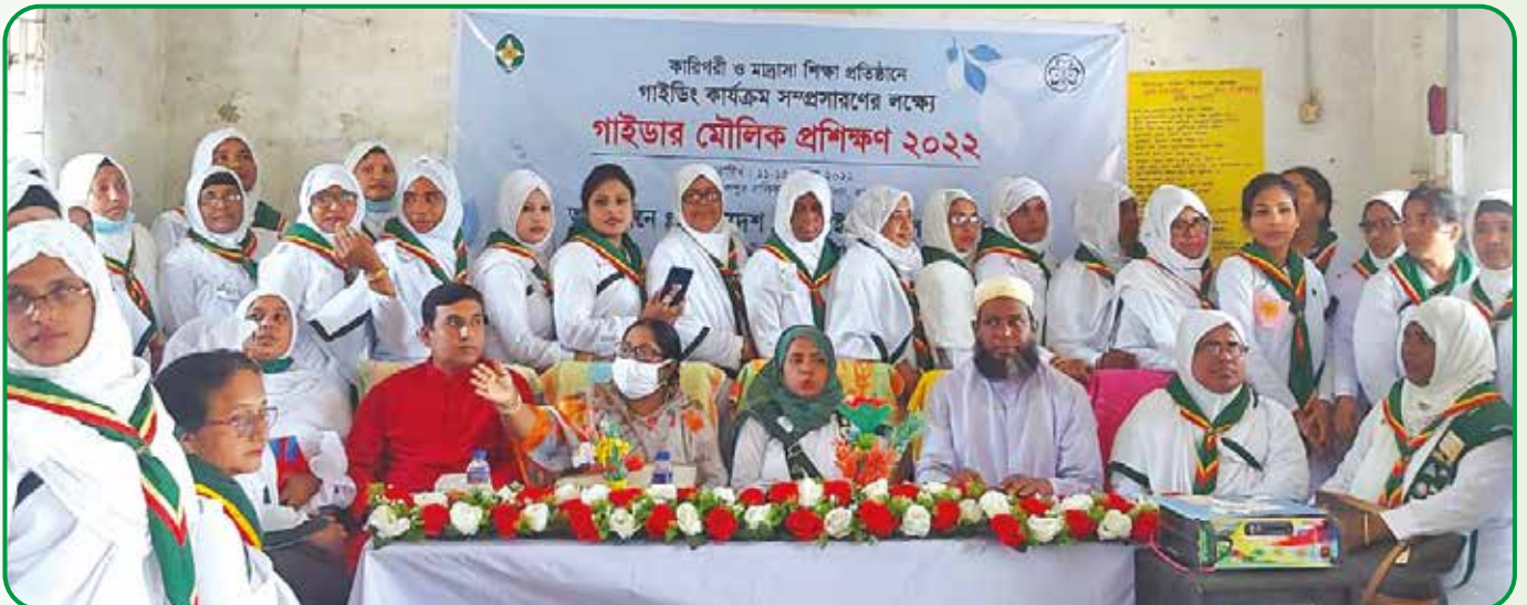
কারিগরি ও মাদ্রাসা শিক্ষা প্রতিষ্ঠানে গাইডিং কার্যক্রম সম্প্রসারণের লক্ষ্যে গাইড গাইডার মৌলিক প্রশিক্ষণে বিভিন্ন শিক্ষা প্রতিষ্ঠান হতে অংশগ্রহণকারী প্রশিক্ষণার্থীবৃন্দ, ময়মনসিংহ অঞ্চল