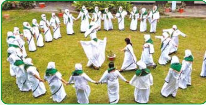
বিজ্ঞ পাখির দল প্রশিক্ষণে ষষ্ঠকের গান করছে