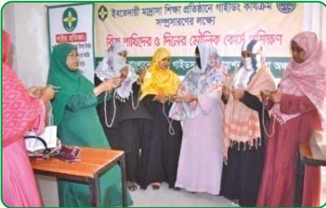
বিজ্ঞ পাখি মৌলিক প্রশিক্ষণে অংশগ্রহণকারীরা প্রশিক্ষণ নিচ্ছেন