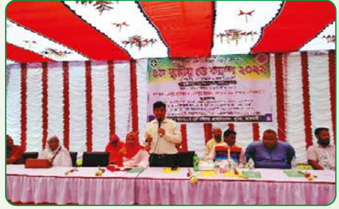
৫ম গাইড ক্যাম্পে অংশগ্রহণকারীদের উদ্দেশ্যে অতিথির বক্তব্য প্রদান

২০ হতে ২৪ মার্চ, ২০২২ কারিগরি ও মাদ্রাসা শিক্ষা প্রতিষ্ঠানে গাইড সম্প্রসারণের লক্ষ্যে জয়পুরহাট জেলার বিভিন্ন উপজেলার ৪০ জন গাইডার এর সমন্বয়ে মুজিবুর রহমান ঢালী স্মৃতি মিলানায়তন, জয়পুরহাটে গাইড গাইডার মৌলিক প্রশিক্ষণ কোর্স অনুষ্ঠিত হয়।