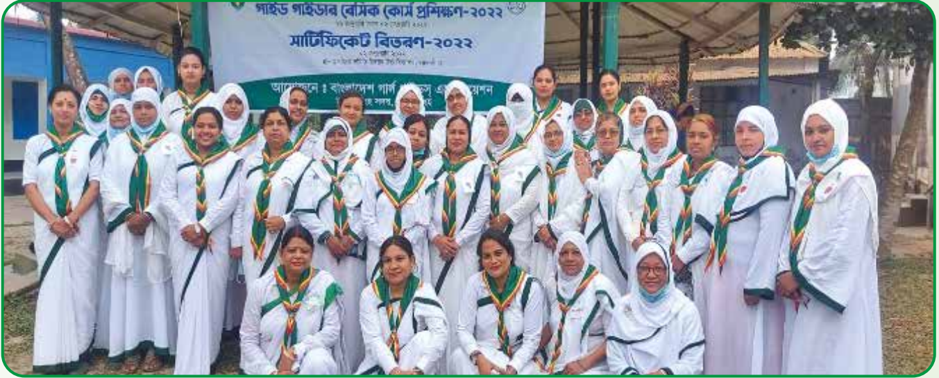
গাইড গাইডার বেসিক কোর্স প্রশিক্ষণে অংশগ্রহণকারীবৃন্দ