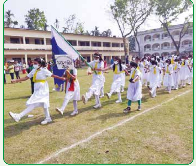
রংপুর জেলার পীরগাছা উপজেলার পীরগাছা মডেল সরকারি প্রাথমিক বিদ্যালয়ের হলদে পাখির ঝাঁক স্বাধীনতা দিবসের মার্চ পাস্টে অংশগ্রহণ করে