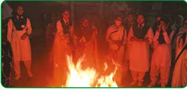
ক্যাস্পে অগ্নি প্রজ্জ্বলন