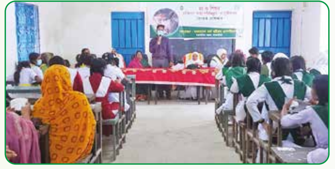
মা ও শিশুর ব্যক্তিগত স্বাস্থ্য, পরিচ্ছন্নতা ও পুষ্টি সাধন বিষয়ক প্রশিক্ষণ