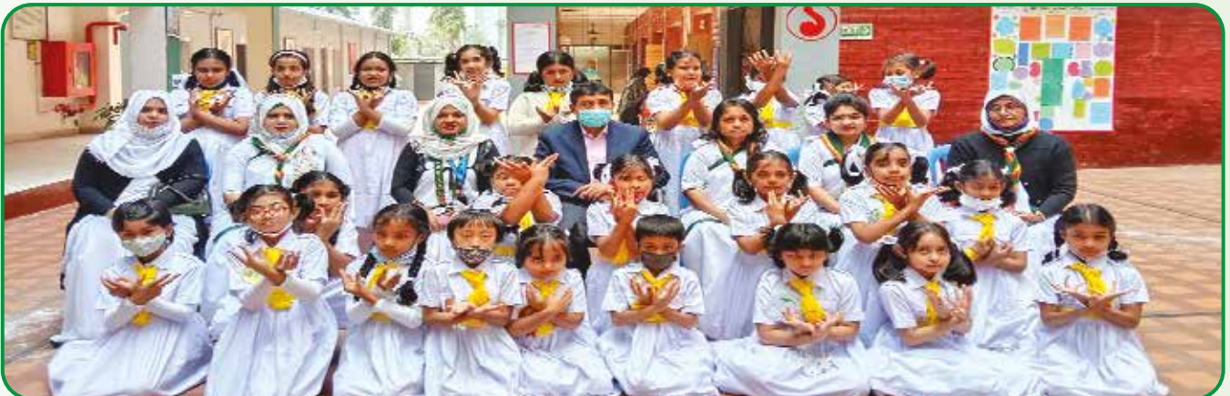
হলদে পাখিদের দীক্ষা দান কর্মসূচি

২৭ জানুয়ারি, ২০২২ রাজধানী আঞ্চলিক কার্যালয়ে, রাজধানী অঞ্চলের ৮ জেলার জেলা কমিশনারদের নিয়ে সভা অনুষ্ঠিত হয়।