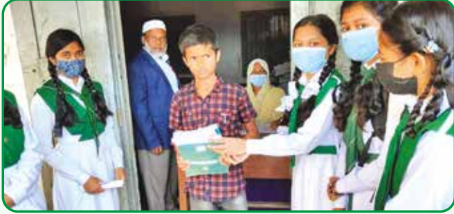
শিবপুর পাইলট মডেল সরকারি উচ্চ বিদ্যালয় নরসিংদীতে শিক্ষার্থীদের মাঝে বই বিতরণ কর্মসূচিতে গাইদের সেবা প্রদান

১ জানুয়ারি, ২০২২ ঢাকা অঞ্চলের প্রতিটি জেলায় বই বিতরণ কর্মসূচি ও জানুয়ারি মাসে বিভিন্ন সময়ে কোভিড-১৯ এর ভ্যাকসিন প্রদান কার্যক্রমে গার্লস গাইডস সদস্যরা সেবা প্রদান করেন।