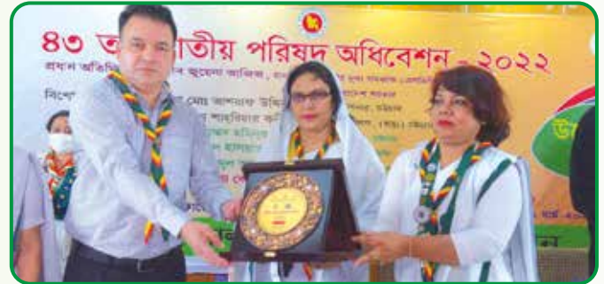
বিশেষ অতিথিকে শুভেচ্ছা স্মারক প্রদান