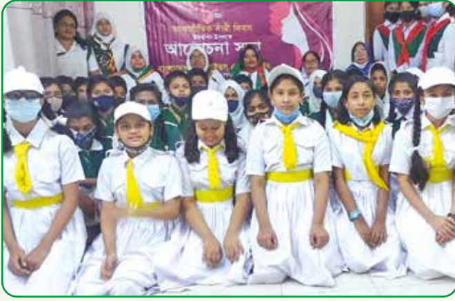
আন্তর্জাতিক নারী দিবস