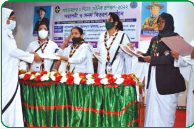
গাইড গাইডার মৌলিক প্রশিক্ষণে অংশগ্রহণকারীদের মাঝে সনদ বিতরণ