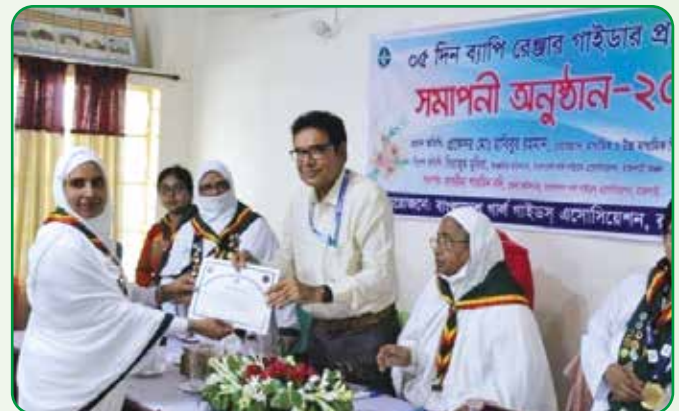
রেঞ্জার গাইডার প্রশিক্ষণে অংশগ্রহণকারী গাইডারবৃন্দের মাঝে সনদ প্রদান