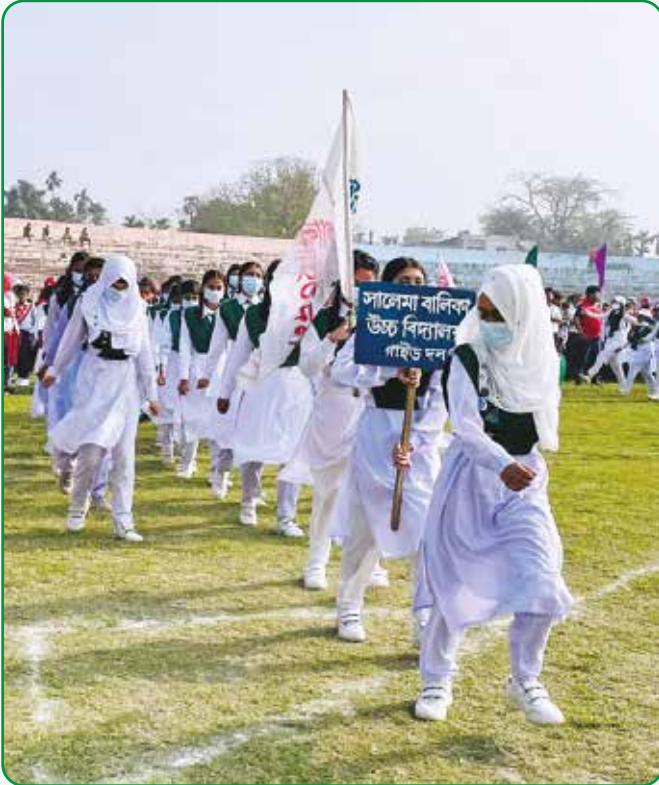
স্বাধীনতা দিবসের মার্চ পাস্টে অংশগ্রহণ করে রংপুর সদরের সালেমা বালিকা উচ্চ বিদ্যালয়ের গাইড দল