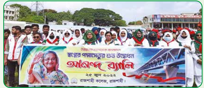
২৫ জুন, ২০২২ পদ্মা সেতুর শুভ উদ্বোধন উপলক্ষে আনন্দ শোভা যাত্রায় রাজশাহী কলেজের রেঞ্জাররা অংশগ্রহণ করে