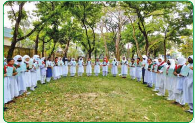
রাজশাহী সরকারি মহিলা কলেজে ৩০ জন রেঞ্জার দীক্ষা গ্রহণ করে

২৯ মার্চ, ২০২২ রাজশাহী জেলার পুঠিয়া উপজেলায় ১ দিনের ৫ম গাইড ক্যাম্প অনুষ্ঠিত হয়। ক্যাম্পে গাইড, গাইডার, সদস্যসহ মোট ৩০০ জন অংশ গ্রহণ করেন।