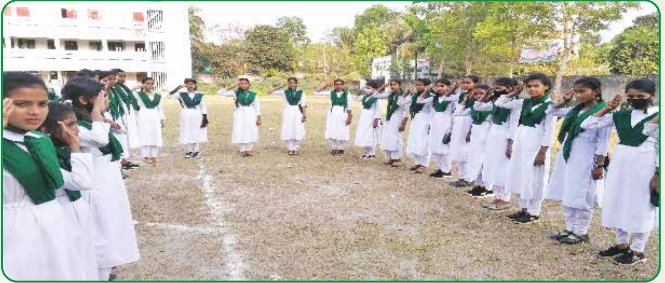
জাজিরা মোহর আলী পাইলট উচ্চ বিদ্যালয়ে দীক্ষা দান অনুষ্ঠান

পরীক্ষা ও দীক্ষা : ২১ মার্চ ২০২২ তারিখ শরীয়তপুর জেলার জাজিরা