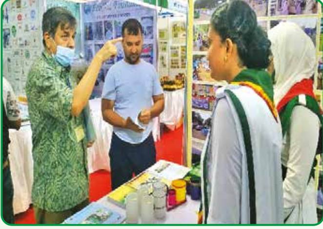
পরিবেশ মেলা চলাকালীন সময়ে বাংলাদেশ গার্ল গাইডস এসোসিয়েশনের স্টলে আসা দর্শনার্থীদের একাংশ