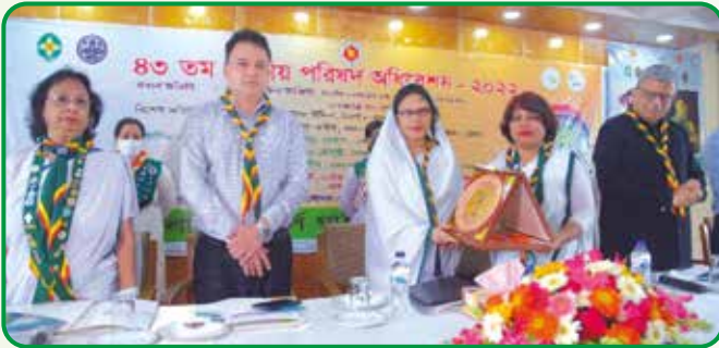
প্রধান অতিথিকে শুভেচ্ছা স্মারক প্রদান