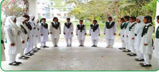
রাজশাহী শিক্ষা বোর্ড মডেল স্কুল ও কলেজের ২১ জন গাইডকে দীক্ষা প্রদান