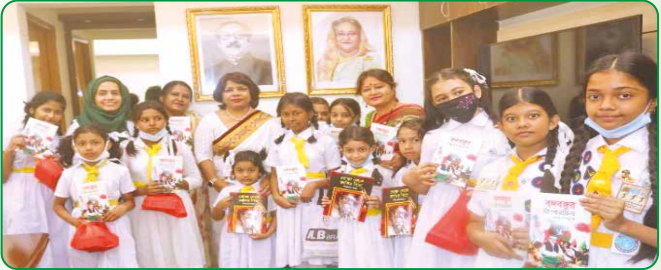
জাতির পিতার জীবনী নিয়ে রচিত গ্রন্থ জাতীয় কমিশনার হলে পাখিদের হাতে তুলে দেন