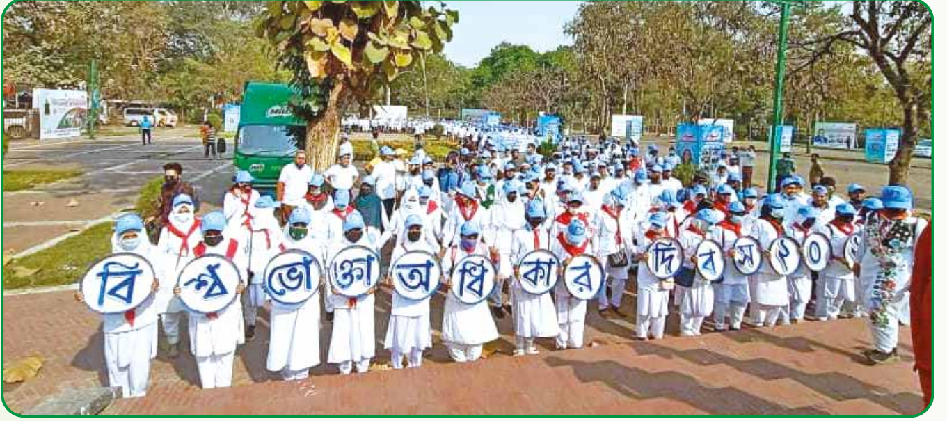
জাতীয় ভোক্তা অধিকার দিবস উদযাপন উপলক্ষে শোভাযাত্রায় অংশগ্রহণকারী রেঞ্জাররা

জাতীয় ভোক্তা অধিকার দিবস : ১৫ মার্চ, ২০২২ জাতীয় ভোক্তা অধিকার সংরক্ষণ অধিদপ্তর কর্তৃক আয়োজিত 'জাতীয় ভোক্তা অধিকার দিবস ২০২২' শোভাযাত্রা ও আলোচনা সভা ওসমানী স্মৃতি মিলনায়তনে উদযাপন করা হয়। কর্মসূচিতে রাজধানী অঞ্চল হতে ৫০ জন রেঞ্জার অংশগ্রহণ করে।