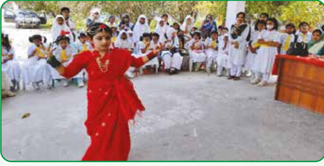
জাতীয় শিশু দিবসে একজন হলদে পাখির নৃত্য পরিবেশন