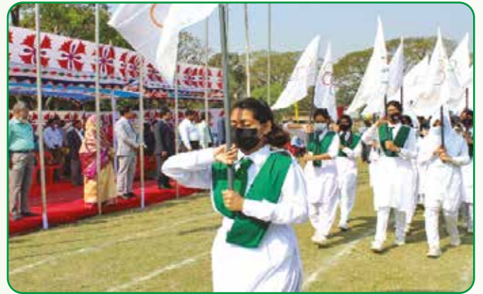
শীতকালীন ক্রীড়া প্রতিযোগিতা অনুষ্ঠানে গাইড কোম্পানির মার্চ পাস্টে অংশগ্রহণ

২২ ফেব্রুয়ারি, ২০২২ গাইড হাউজ, বিলসিমলা রাজশাহীতে বিশ্বচিন্তা দিবস পালিত হয়। বিশ্বের ১৫২টি দেশে এই দিনটিকে World Thinking Day হিসেবে পালন করা হয়।