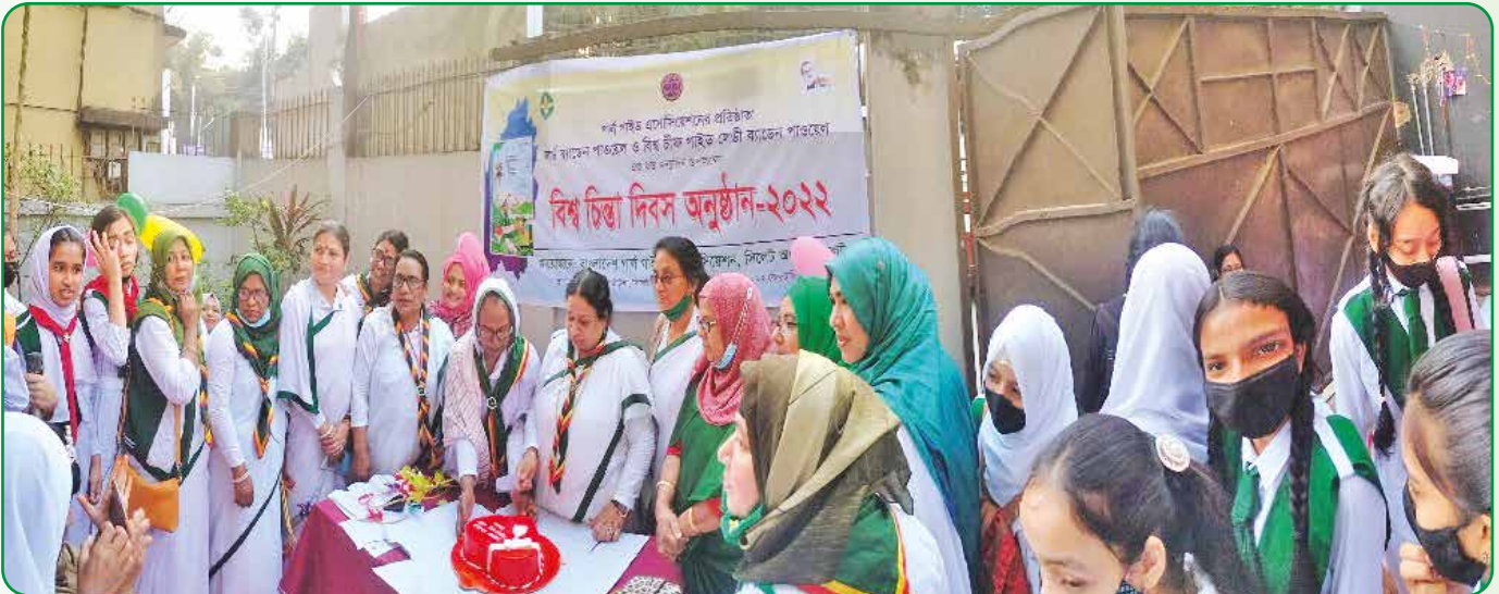
বিশ্ব চিন্তা দিবসে কেক কেটে লর্ড ও লেডি ব্যাডেন পাওয়েল এর জন্মদিন পালন করা হয়

বাণী পাঠ, চিন্তা দিবসের চাঁদা প্রদান, সাংস্কৃতিক অনুষ্ঠান। অনুষ্ঠানে সিলেট অঞ্চলের বিভিন্ন শিক্ষা প্রতিষ্ঠান হতে প্রায় ১০০ জন, হলদে পাখি, গাইড, রেঞ্জার, গাইডার অংশগ্রহণ করেন। এছাড়া আঞ্চলিক ও জেলা কমিটির সদস্যগণও উপস্থিত ছিলেন।