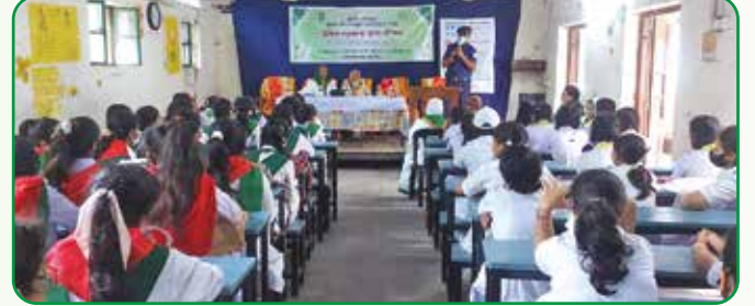
ট্রাফিক সচেতনতা মূলক প্রশিক্ষণে হলদে পাখি, গাইড ও রেঞ্জাররা প্রশিক্ষণ নিচ্ছে