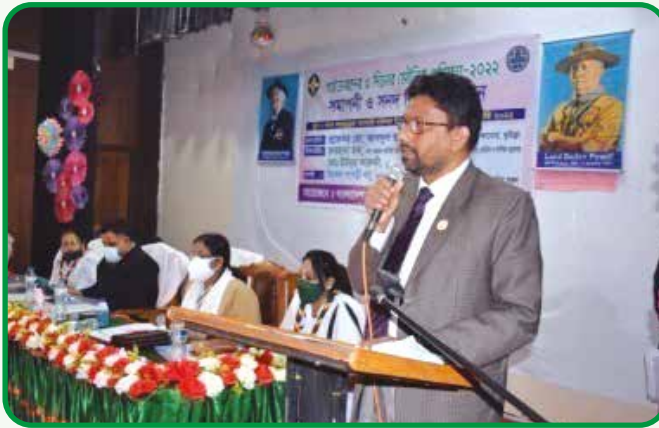
গাইড গাইডার মৌলিক প্রশিক্ষণে অতিথিদের বক্তব্য প্রদান