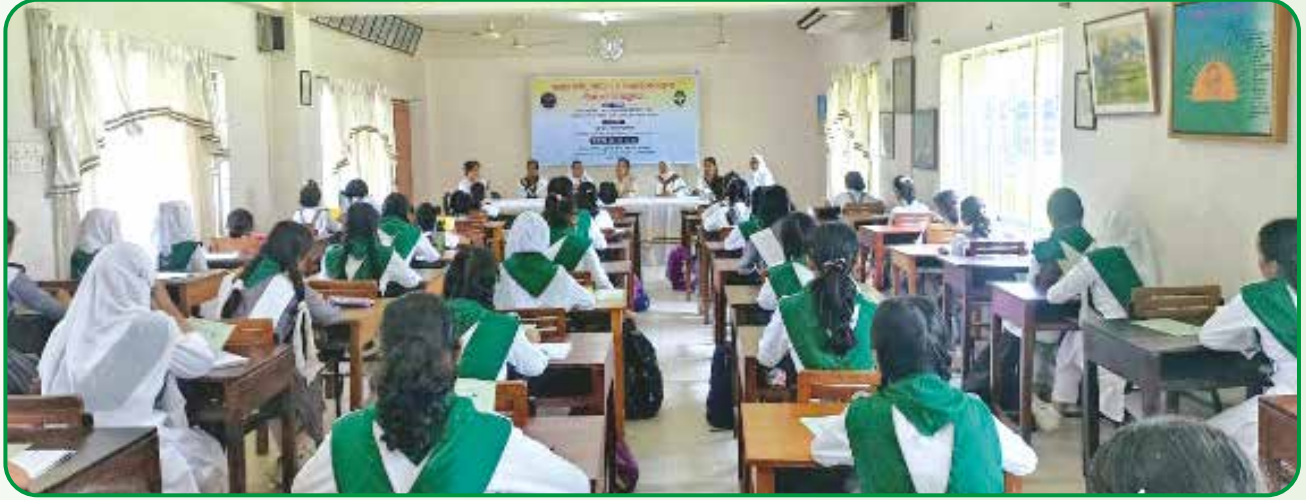
মর্নিং গ্রোার স্কুলের দীক্ষাপ্রাপ্ত গাইড কোম্পানি, সাভার