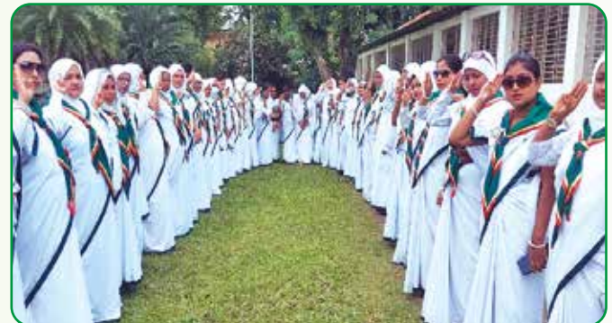
মৌলিক প্রশিক্ষণে অংশগ্রহণকারীরা প্রশিক্ষণ শেষে সালাম প্রদর্শন করেন