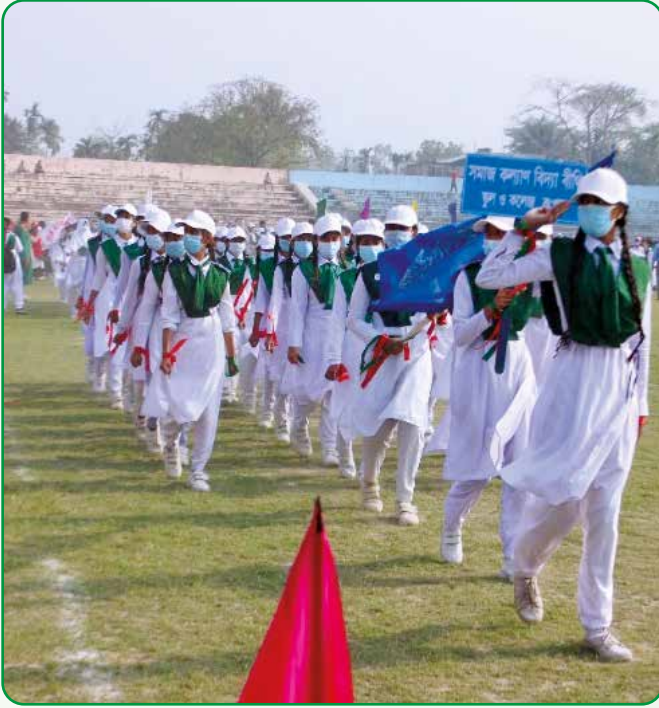
স্বাধীনতা দিবসের মার্চ পাস্টে অংশগ্রহণ করে রংপুর সদরের সমাজকল্যাণ বিদ্যাবিধী বালিকা উচ্চ বিদ্যালয় ও কলেজের গাইডউত্তর রেঞ্জারদল