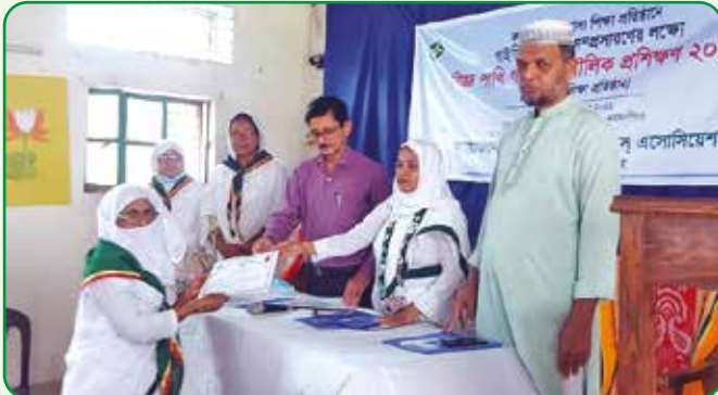
সার্টিফিকেট বিতরণ বিজ্ঞ পাখি মৌলিক প্রশিক্ষণ, কারিগরি ও মাদ্রাসা