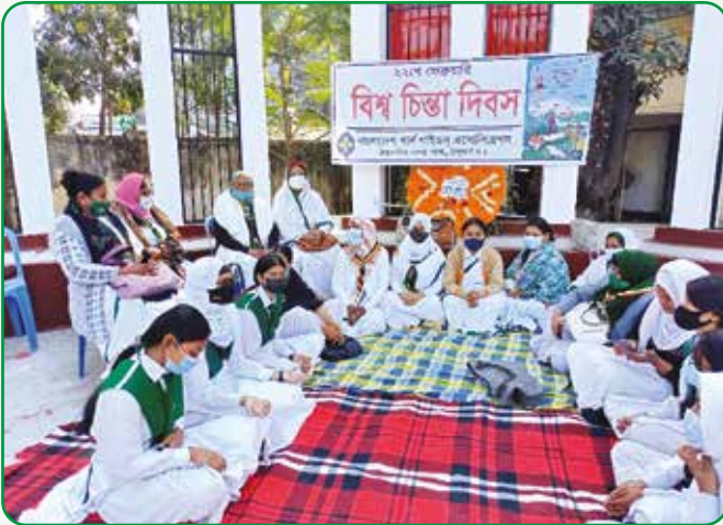
ঠাকুরগাঁও জেলা এসোসিয়েশন আয়োজিত বিশ্ব চিন্তাদিবস এর আলোচনা সভায় গাইডার ও গাইড

বিশ্ব চিন্তা দিবস উদযাপন : ২২ ফেব্রুয়ারি, ২০২২ ঠাকুরগাঁও জেলা ও স্থানীয় এসোসিয়েশন প্রতিজ্ঞা নবায়ন, আলোচনা সভা ও চাঁদা সংগ্রহের মাধ্যমে বিশ্ব চিন্তা দিবস উদযাপন করে। জেলা ও স্থানীয় এসোসিয়েশনের সদস্যবৃন্দ এবং গাইড দল সহ অনুষ্ঠানে ৩০ জন উপস্থিত ছিলেন।