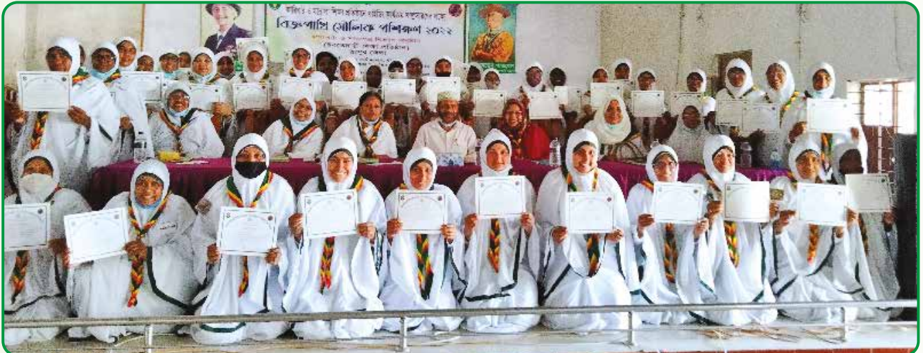
ইবতেদায়ী শাখায় বিজ্ঞ পাখি মৌলিক প্রশিক্ষণের নতুন দীক্ষাপ্রাপ্ত গাইডারবৃন্দ