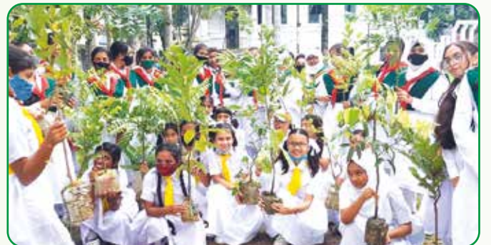
বৃক্ষরোপণ কর্মসূচিতে হলদে পাখিদের অংশগ্রহণ

বৃক্ষরোপনে সক্রিয়ভাবে অংশগ্রহণ করেন প্রধান অতিথিসহ বিশেষ অতিথি, সাংবাদিক, গাইড সদস্যবৃন্দ কার্যনির্বাহী কমিটির সদস্য, হলদে পাখি, গাইড ও রেঞ্জার। বিভিন্ন প্রতিষ্ঠান থেকে আগত হলদে পাখি, গাইড, রেঞ্জারদের ফলদ, বনজ ও ঔষধি গাছ নিজ নিজ বিদ্যালয়ে প্রাপ্তনে রোপন করার জন্য বিতরণ করা হয়।