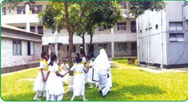
সাভার ক্যান্টনমেন্ট পাবলিক স্কুল এন্ড কলেজে হলদে পাখিদের দীক্ষা দান