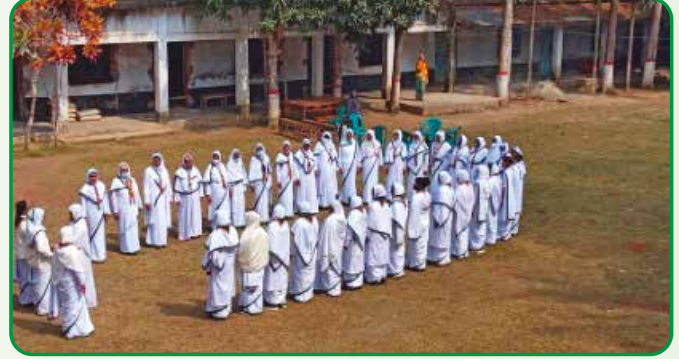
গাইড গাইডার মৌলিক প্রশিক্ষণে প্রশিক্ষণরত অংশগ্রহণকারীবৃন্দ