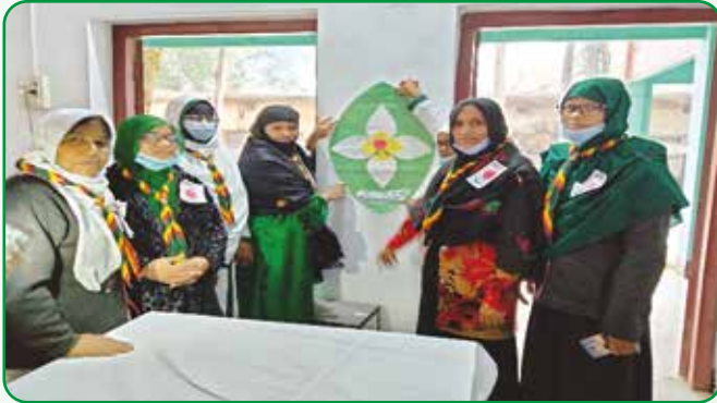
গাইড গাইডার প্রশিক্ষণ কোর্স

কারিগরি ও মাদ্রাসায় গাইড সম্প্রসারণের লক্ষ্যে ২৩ হতে ২৭ জানুয়ারি, ২০২২ নাটোর জেলায় ৪০ জন কারিগরি ও মাদ্রাসার শিক্ষকদের সমন্বয়ে গাইড গাইডার প্রশিক্ষণ কোর্স অনুষ্ঠিত হয়।