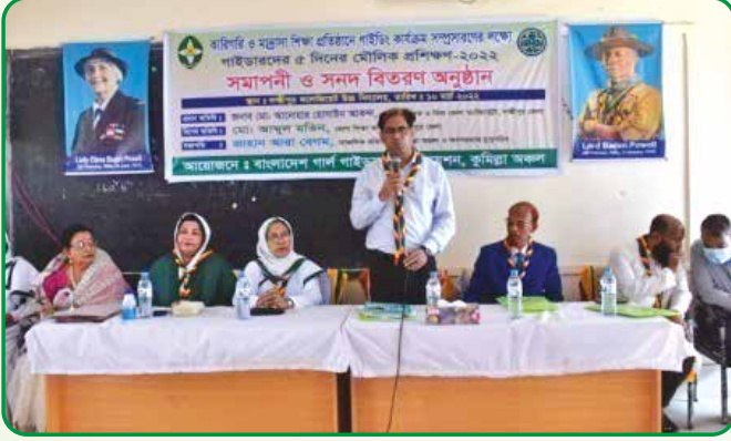
লক্ষ্মীপুর কলেজিয়েট উচ্চ বিদ্যালয়ে গাইড গাইডার কোর্স প্রশিক্ষণে অতিথির বক্তব্য