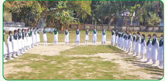
দীক্ষাপ্রাপ্ত গাইড কোম্পানি