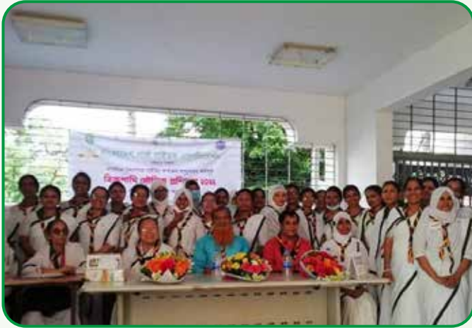
বিজ্ঞ পান্থি মৌলিক প্রশিক্ষণে অংশগ্রহণকারীদের মাঝে সনদ প্রদান