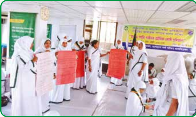
হলদে পাখি গাইডার মৌলিক প্রশিক্ষণে প্রশিক্ষণরত মাদ্রাসা শিক্ষা প্রতিষ্ঠানের শিক্ষিকাবৃন্দ