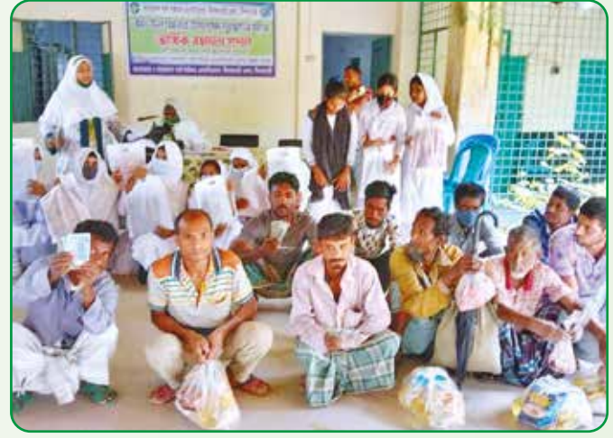
রংপুর আঞ্চলিক তহবিলের সহায়তায় নীলফামারী জেলা এসোসিয়েশন দরিদ্র শিক্ষার্থী ও দুঃস্থ মানুষের মাঝে আর্থিক সহায়তা ও খাদ্য সামগ্রী বিতরণ করা হয়