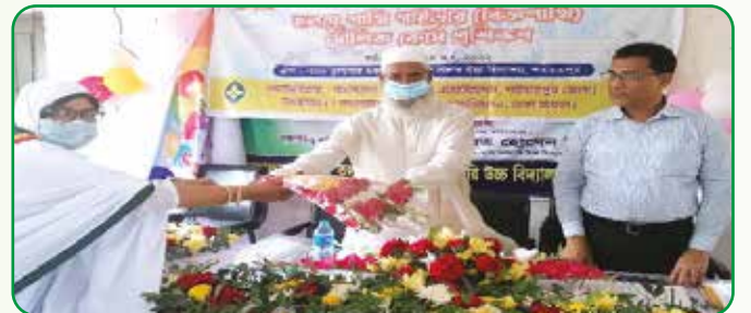
শরীয়তপুর জেলায় গাইড গাইডার প্রশিক্ষণ