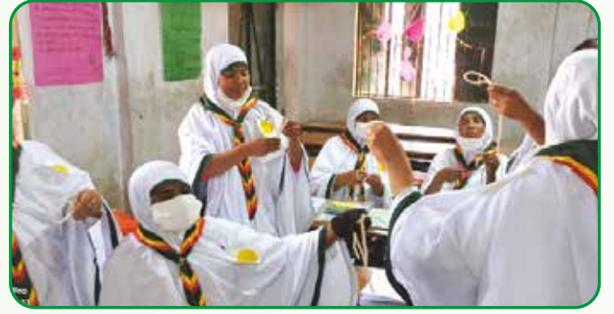
গাজীপুর জেলায় গাইড গাইডার মৌলিক প্রশিক্ষণে প্রশিক্ষণরত গাইডারবৃন্দ