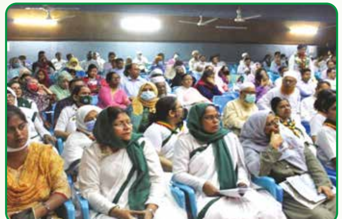
সেমিনারে অংশগ্রহণকারীদের একাংশ