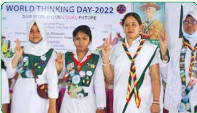
হলদে পাখি, গাইড ও রেঞ্জারদের প্রতিভা নবায়ন