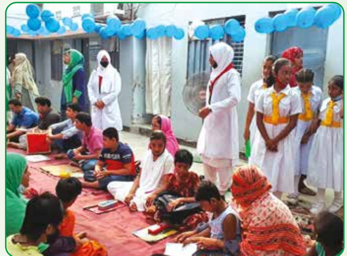
বিভিন্ন চাহিদা সম্পন্ন শিশুদের মাঝে বন্ধুত্ব স্থাপন করা হয়

ডেঙ্গু থেকে বাঁচার উপায়, বিদ্যালয়, অফিসে, বাসাবাড়িতে বা বাড়ির ছাদে টবে টায়ার, ডাবের খোসা, প্রাস্টিকের পাত্রে পানি জমলে সাথে সাথে পরিষ্কার করুন। ৩ দিনে ১ দিন জমা পানি ফেলে দিন।