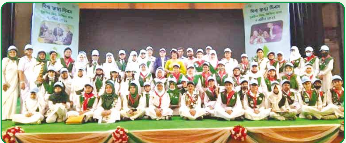
বিশ্ব স্বাস্থ্য দিবস উদযাপন অনুষ্ঠানে উপস্থিত অতিথিদের সাথে অংশগ্রহণকারী বাংলাদেশ গার্ল গাইডস এসোসিয়েশনের জাতীয় কমিশনারসহ সদস্যবৃন্দ

অনুষ্ঠানে কমিশনারবৃন্দ, জাতীয় কার্যালয় ও রাজধানী অঞ্চলের কর্মকর্তাবৃন্দ, গাইডার, গাইড ও রেঞ্জার সহ প্রায় ১০০ জন গাইড সদস্য অংশগ্রহণ করেন।