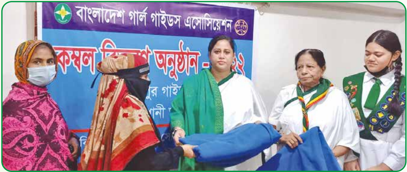
মোহাম্মদপুর জেলায় সমাজের সুবিধাবঞ্চিত মানুষের মাঝে কম্বল বিতরণ

শীতবস্ত্র বিতরণ : ৩ জানুয়ারি, ২০২২ রাজধানী অঞ্চল আয়োজিত মোহাম্মদপুর জেলার উদ্যোগে মোহাম্মদপুরে সমাজের সুবিধাবঞ্চিত মানুষের মাঝে কম্বল বিতরণ করা হয়।