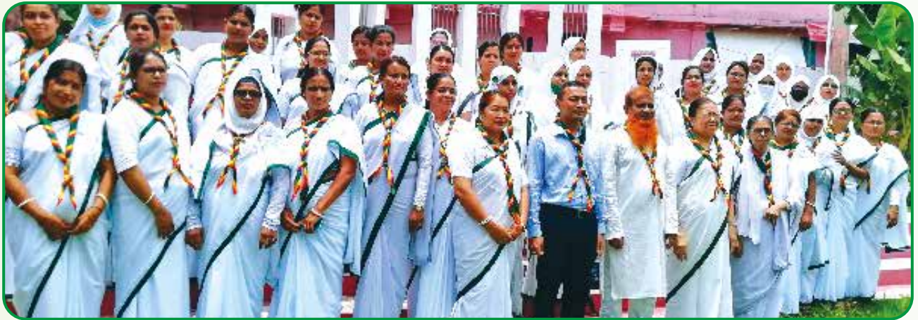
গাইড গাইডার প্রশিক্ষণে অংশগ্রহণকারী বৃন্দ