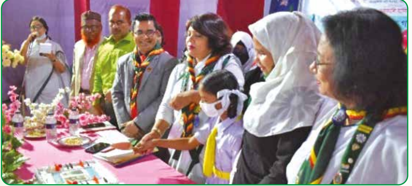
বিশ্ব চিন্তা দিবস অনুষ্ঠানে জাতীয় কমিশনার ও অন্যান্য অতিথিবৃন্দ