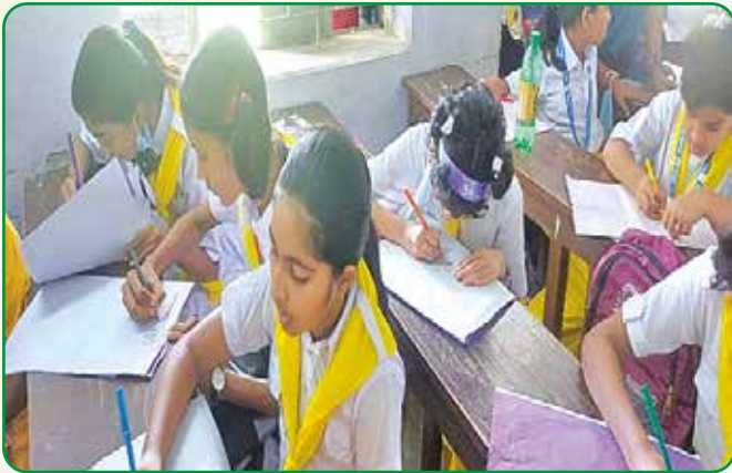
আঞ্চলিক পর্যায়ে হলদে পাখি কার্ণিভাল