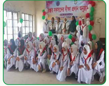
সাতার মডেল কলেজে দীক্ষাপ্রাপ্ত রেঞ্জার