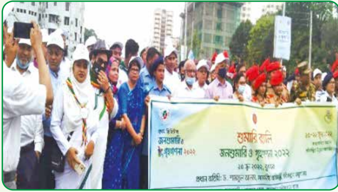
জনশুমারি ও গৃহগণনা কার্যক্রমের র্যালিতে গাইড সদস্যদের অংশগ্রহণ