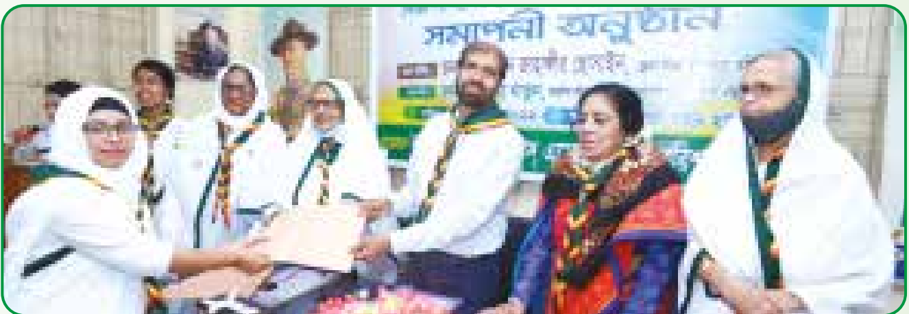
বরিশাল গাইড হাউজে অনুষ্ঠিত বিজ্ঞ পাখি মৌলিক প্রশিক্ষণে অংশগ্রহণকারীদের মাঝে সনদ বিতরণ

বিজ্ঞ পাখি প্রশিক্ষণ : ১৭ হতে ২১ এপ্রিল কারিগরি ও মাদ্রাসা শিক্ষা প্রতিষ্ঠানের ৪০ জন শিক্ষিকা বিজ্ঞ পাখি মৌলিক প্রশিক্ষণ বরিশাল গাইড হাউজে অংশগ্রহণ করে।