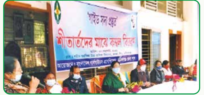
মানিকগঞ্জ জেলায় শীত বস্ত্র বিতরণ

Tide Turners Plastic Challenge Badge প্রশিক্ষণ : ২৯ জানুয়ারি, ২০২২ জাতীয় কার্যালয় আয়োজিত Tide Turners Plastic Challenge Badge প্রকল্পের প্রশিক্ষণে ঢাকা অঞ্চলের নরসিংদী, মুন্সিগঞ্জ, টাঙ্গাইল, গাজীপুর ও ঢাকা জেলা হতে ১৪ জন গাইড গাইডার প্রশিক্ষণ গ্রহণ করেন।