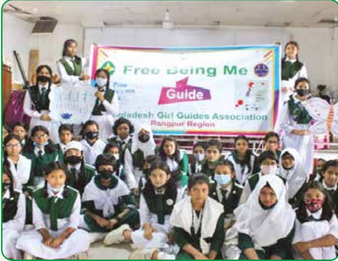
ফ্রি বিইং মি সেশনে রংপুর জেলা সদরের গাইড দল