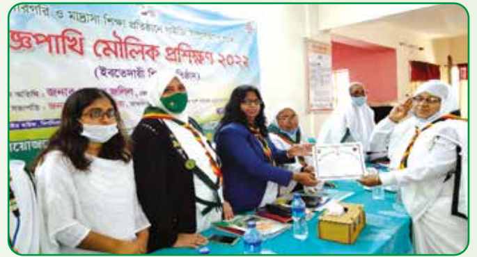
বিজ্ঞ পাখি মৌলিক প্রশিক্ষণে অংশগ্রহণকারীদের সনদ প্রদান

৭ ফেব্রুয়ারি, ২০২২ বাগমারা উপজেলায় ৫০ জন ও ২৭ ফেব্রুয়ারি বাঘা উপজেলায় ৫০ জন গাইডকে দীক্ষা প্রদান করা হয়।