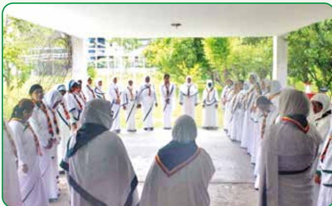
রেঞ্জার গাইডার প্রশিক্ষণে অংশগ্রহণকারী গাইডারবৃন্দ