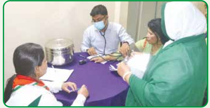
চট্টগ্রাম সিভিল সার্জন কার্যালয়ের উদ্যোগে কাউন্সিলরদের স্বাস্থ্য পরীক্ষা করা হয় বরিশাল, সিলেট, কুমিল্লা, রংপুর ও ময়মনসিংহসহ ১০ অঞ্চলে হতে তিন শতাধিক কাউন্সিলর অংশগ্রহণ করেন।