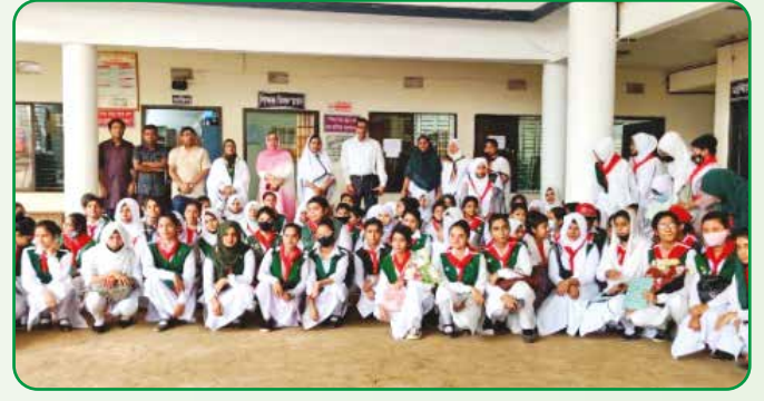
সাভার উপজেলায় ইনভেস্টিচার প্রশিক্ষণ