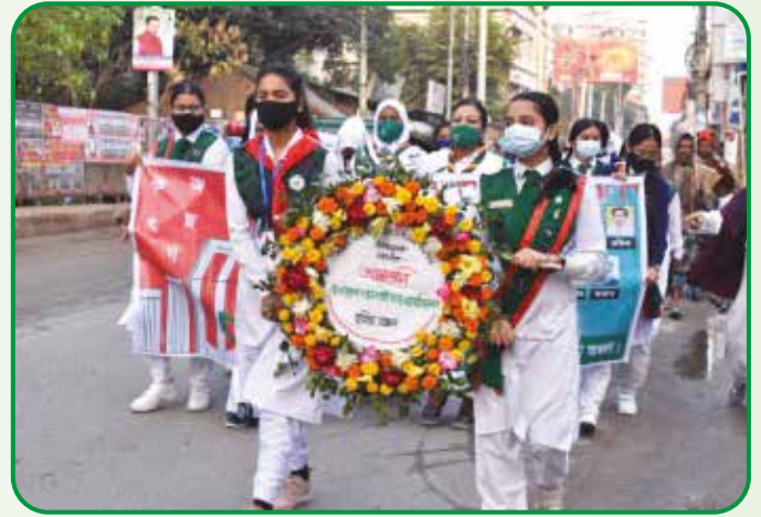
২১ ফেব্রুয়ারি ২০২২ শহিদদের প্রতি শ্রদ্ধা নিবেদন