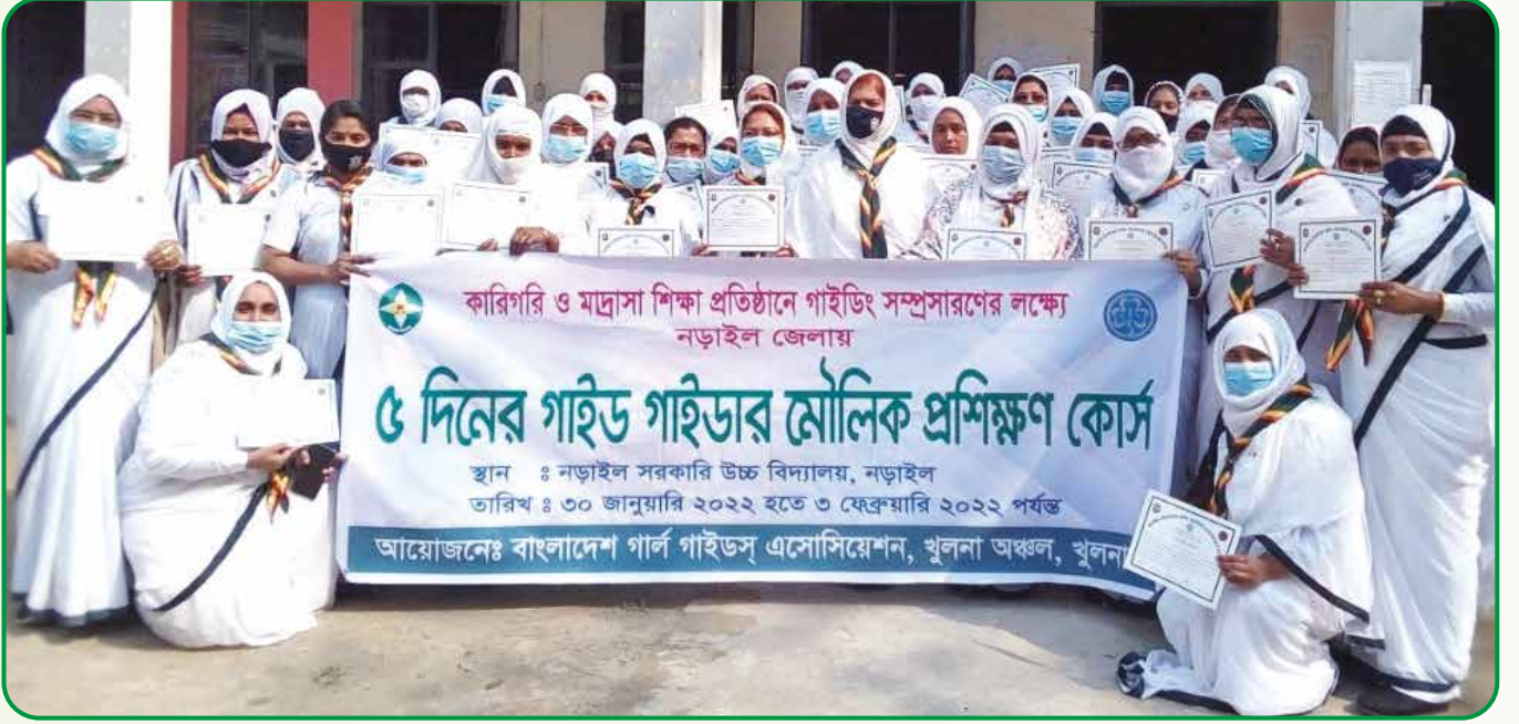
নড়াইল সরকারি বালিকা উচ্চ বিদ্যালয় প্রাঙ্গণে ৫দিন ব্যাপী গাইড গাইডার মৌলিক প্রশিক্ষণ কোর্স অংশগ্রহণকারীবৃন্দ