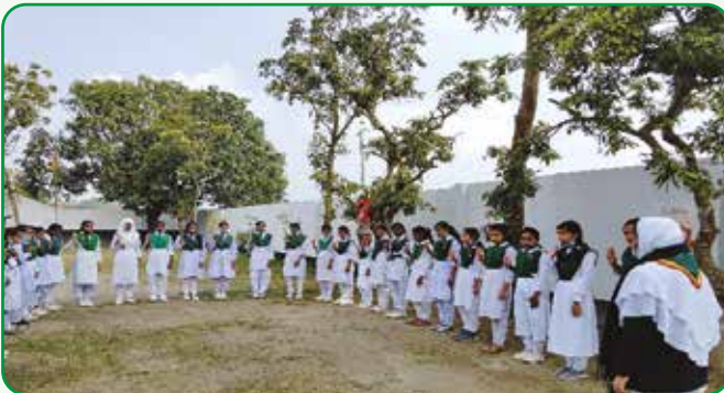
গাইডদের দীক্ষা প্রদান