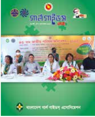
চট্টগ্রামে অনুষ্ঠিত ২৮-৩১ মার্চ ২০২২ পর্যন্ত বাংলাদেশ গার্ল গাইডস এসোসিয়েশনের ৪৩ তম জাতীয় পরিষদ অধিবেশনের আলোকচিত্র