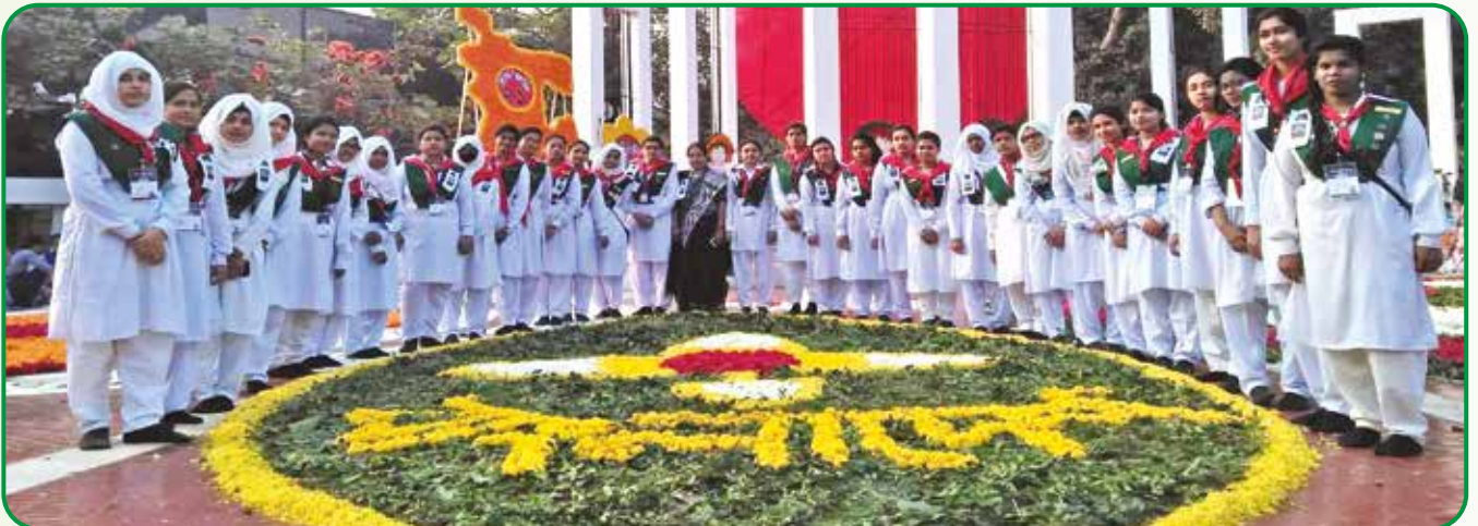
ফেব্রুয়ারি আন্তর্জাতিক মাতৃভাষা দিবস উপলক্ষে ঢাকা বিশ্ববিদ্যালয় রেঞ্জার ইউনিটের উদ্যোগে কেন্দ্রীয় শহীদ মিনারে ফুল দিয়ে তৈরীকৃত টেভারফুট ব্যাজের সামনে গাইডারসহ বেচ্ছাসেবক হিসেবে সার্ভিস প্রদানকারী রেঞ্জারদের একাংশ

বিশ্ব চিন্তা দিবস উদযাপন : ২২ ফেব্রুয়ারি লর্ড ব্যাডেন পাওয়েল ও লেডী ব্যাডেন পাওয়েল এর যুগ্ম জন্ম দিন। ২৬ ফেব্রুয়ারি, ২০২২ জাতীয় কার্যালয় ও রাজধানী অঞ্চল এর যৌথ আয়োজনে গাইড হাউজ অডিটোরিয়াম, ঢাকায় বিশ্ব চিন্তা দিবস অনুষ্ঠিত হয়।