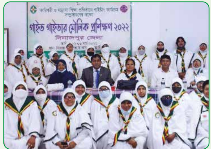
দিনাজপুর জেলায় গাইড গাইডার মৌলিক প্রশিক্ষণের নতুন দীক্ষাপ্রাপ্ত গাইডারবৃন্দ