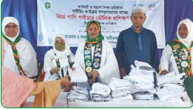
প্রশিক্ষণার্থীদের মাঝে ইউনিফর্ম বিতরণ করেন আঞ্চলিক কমিশনার