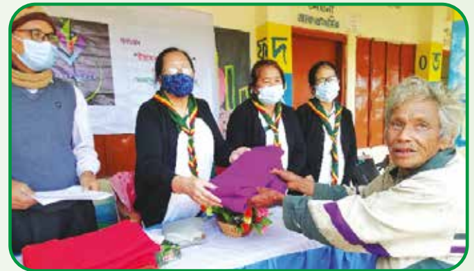
কাবুক্যাপাড়া সরকারি প্রাথমিক বিদ্যালয়ে ছাত্র-ছাত্রী এবং বয়স্কদের মাঝে শীতবস্ত্র বিতরণ

১০ ফেব্রুয়ারি “ইরামন ফাউন্ডেশন” এর সহযোগিতায় রাঙ্গামাটি গার্ল গাইডস এসোসিয়েশন এর পক্ষ থেকে কাবুক্যাপাড়া সরকারি প্রাথমিক বিদ্যালয়ে ছাত্র-ছাত্রী এবং বয়স্কদের মাঝে কঞ্চল ও জ্যাকেট বিতরণ করা হয়।