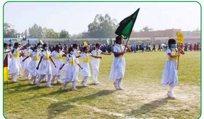
স্বাধীনতা দিবসের মার্চ পাস্টে অংশগ্রহণ করে রংপুর সরকারি বালিকা উচ্চ বিদ্যালয়ের হলদে পাখির দল

স্বাধীনতা দিবস : ২৬ মার্চ, ২০২২ স্বাধীনতা দিবস উপলক্ষে রংপুর স্টেডিয়াম এ রংপুর সদরের ১৩টি প্রতিষ্ঠানের ৩৯০ জন গাইড ও ৩টি প্রতিষ্ঠানের ৭২ জন হলদে পাখি কুচকাওয়াজে অংশগ্রহণ করে। ডিসপ্লে তে রংপুর সরকারি বালিকা উচ্চ বিদ্যালয়ের গাইড দল ২য় ও হলদে পাখির ঝাঁক ৩য় স্থান অর্জন করে।