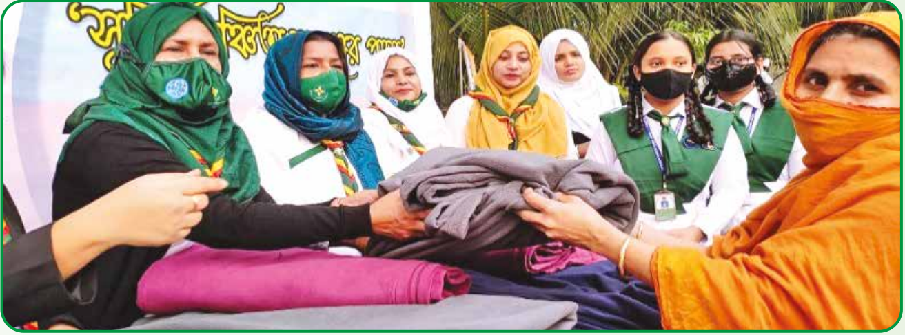
মিরপুর জেলায় সুবিধাবঞ্চিত মানুষের মাঝে শীতবস্ত্র বিতরণ