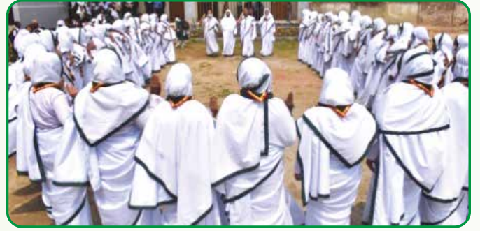
কুমিল্লা হাইস্কুলে অনুষ্ঠিত ইবতেদায়ী শিক্ষা প্রতিষ্ঠানে হলদে পাখি গাইডার কোর্স প্রশিক্ষণে অংশগ্রহণকারীবৃন্দ

সময়মত টিটি টিকা দিন মা ও শিশুর জীবন সুরক্ষিত করুন