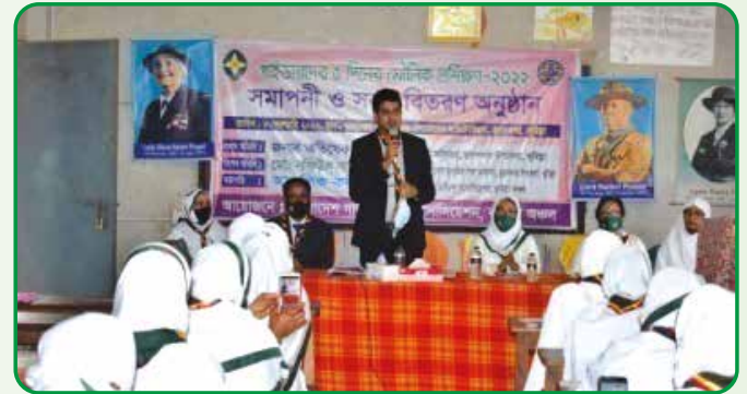
গাইড গাইডার মৌলিক প্রশিক্ষণের সনদ বিতরণ অনুষ্ঠানে অতিথির বক্তব্য