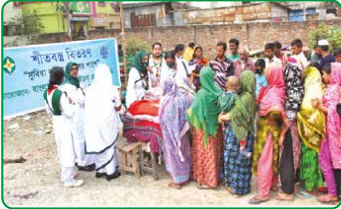
রাজধানী অঞ্চলের উদ্যোগে সুবিধাবঞ্চিতদের মাঝে শীতবস্ত্র বিতরণ

আন্তর্জাতিক মাতৃভাষা দিবস পালন : ২১ ফেব্রুয়ারি, ২০২২ আন্তর্জাতিক মাতৃভাষা দিবস উপলক্ষে ঢাকা বিশ্ববিদ্যালয় রেঞ্জার ইউনিটের উদ্যোগে কেন্দ্রীয় শহীদ মিনারে পুষ্পস্তবক অর্পণ সহ ভাষা শহীদের প্রতি শ্রদ্ধা জানানো হয় এবং দিনব্যাপী কেন্দ্রীয় শহীদ মিনার এলাকায় ঢাকা বিশ্ববিদ্যালয়ের ৫টি হল থেকে ২০০ জন রেঞ্জার সার্ভিস প্রদান করে।