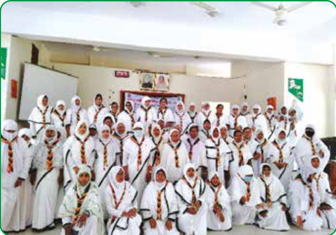
গাইড গাইডার মৌলিক প্রশিক্ষণ অংশগ্রহণকারী গাইডারবৃন্দ

১৭ মার্চ, ২০২২ বাংলাদেশ গার্ল গাইডস এসোসিয়েশন, রাজশাহী অঞ্চলের উদ্যোগে গাইড হাউজ, বিলসিমলায় জাতির পিতার জন্ম বার্ষিকী ও জাতীয় শিশু দিবস উপলক্ষে হলদে পাখিদের অংশগ্রহণে সাংস্কৃতিক প্রতিযোগিতা, যেমন: গান, নৃত্য, কবিতা আবৃত্তি, ছড়া ইত্যাদি অনুষ্ঠিত হয়। উক্ত অনুষ্ঠানে ১০০ জন হলদে পাখি অংশগ্রহণ করে।