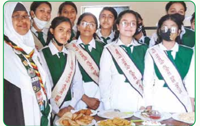
নৈপুণ্যসূচক ব্যাজ পরীক্ষায় অংশগ্রহণকারী পঞ্চগড় সরকারি বালিকা উচ্চ বিদ্যালয়ের গাইডদল