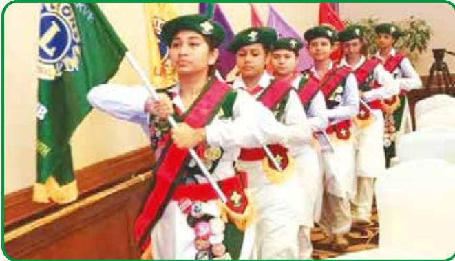
প্যান প্যাসিফিক সোনারগাঁও হোটেল ঢাকায় লায়ন জেলা -৩১৫বি২ বাংলাদেশের ২৯তম বার্ষিক সম্মেলন ২০২২ এর উদ্বোধনী অনুষ্ঠানে বর্ণাঢ্য ফ্লাগ ডিসপ্লে প্রদর্শনের জন্য রাজধানী অঞ্চল হতে অংশগ্রহণকারী রেঞ্জাররা