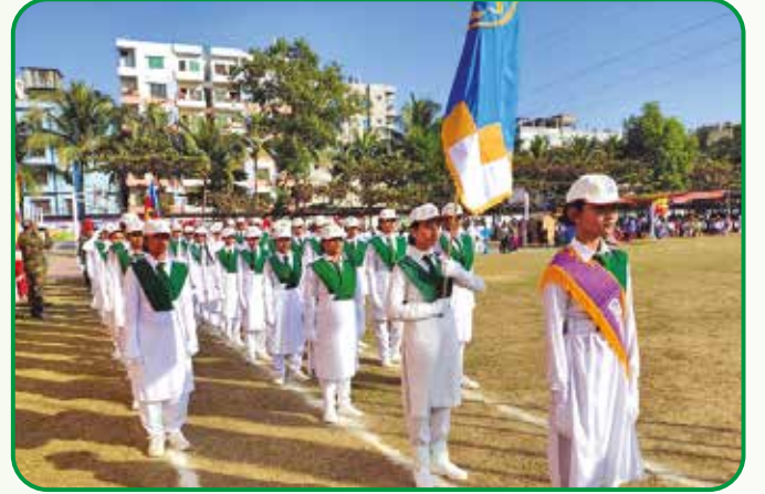
স্বাধীনতার সূবর্ণ জয়ন্তী উপলক্ষে অনুষ্ঠিত কুচকাওয়াজে গাইডদের অংশগ্রহণ

মহান স্বাধীনতা দিবস পালন : ২৬ মার্চ, ২০২২ মহান স্বাধীনতা ও সূবর্ণ জয়ন্তী উপলক্ষে চট্টগ্রাম জেলা প্রশাসনের ব্যবস্থাপনায় এম.এ.আজিজ স্টেডিয়ামে কুচকাওয়াজ অনুষ্ঠানে সেন্ট ফ্লোসাসটিকা বালিকা স্কুল এন্ড কলেজ এর ২৬ জন হলদে পাখি, অপর্ণাচরণ সিটি কর্পোরেশন বালিকা স্কুল এন্ড কলেজ এর ২৭ জন গাইড, রহমানিয়া উচ্চ বিদ্যালয় এর ১২ জন গাইড, ডাঃ খালুগীর সরকারি বালিকা উচ্চ বিদ্যালয় এর ৮ জন গাইড, ওমর গণি এম.ই.এস. কলেজ এর ৯ জন রেঞ্জার, মহিলা কলেজ এনায়েত বাজার হতে ৪ জন রেঞ্জার, হালিশহর ক্যান্টনমেন্ট পাবলিক কলেজ হতে ৪ জন রেঞ্জার, বিজ্ঞ পাখি গাইডার, গাইড গাইডার, রেঞ্জার গাইডার ৪ জন এবং অফিস স্টাফ ৩ জন সহ ১১১ জন অংশগ্রহণ করে। এছাড়া অঞ্চলের পাঁচটি জেলা এবং উপজেলার সকল শিক্ষা প্রতিষ্ঠানে যথাযোগ্য মর্যাদায় দিবসটি পালন করা হয়।