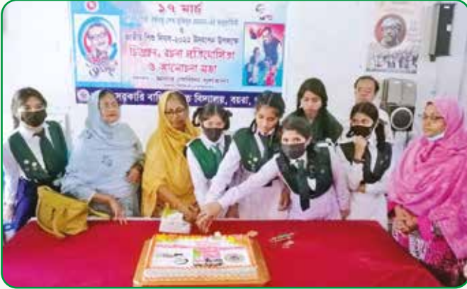
বঙ্গবন্ধুর জন্মদিবস ও জাতীয় শিশু দিবস উদযাপন

জাতীয় শিশু দিবস উদযাপন : খুলনা অঞ্চলের খুলনা সরকারি বালিকা উচ্চ বিদ্যালয়, সবুরগনেছা মাধ্যমিক বিদ্যালয়, বয়রা ডাক বিভাগীয় মাধ্যমিক বিদ্যালয়, খুলনা ১৭ মার্চ ২০২২ বঙ্গবন্ধুর জন্ম দিবস ও জাতীয় শিশু দিবস উদযাপন উপলক্ষে সূর্যোদয়ের সাথে জাতীয় পতাকা উত্তোলন বঙ্গবন্ধু শেখ মুজিবুর রহমানের প্রতিকৃতিতে পুষ্পার্ঘ্য অর্পণ, চিত্রাংকণ ও রচনা প্রতিযোগিতা, শেখ রাসেল দেয়ালিকা উপস্থাপন, বিশেষ আলোচনা সভা, কেক কাটা ও মোনাজাতের আয়োজন এবং বিজয়ী হলদে পান্থি, গাইডদের বই প্রদান করা হয়।