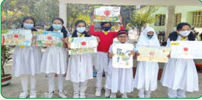
চিত্রাংকন প্রতিযোগিতায় অংশগ্রহণকারী হলে পাখি

কারিগরি ও মাদ্রাসায় গাইড সম্প্রসারণের লক্ষে ১৩ হতে ১৭ ফেব্রুয়ারি ২০২২ রাজশাহী জেলায় মাদ্রাসার ইবতেদায়ী শাখা থেকে ৪০ জন শিক্ষিকার সমন্বয়ে বিজ্ঞ পাখি মৌলিক প্রশিক্ষণ অনুষ্ঠিত হয়।