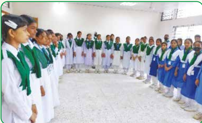
সাভার ল্যাবরেটরি স্কুলে দীক্ষা দান