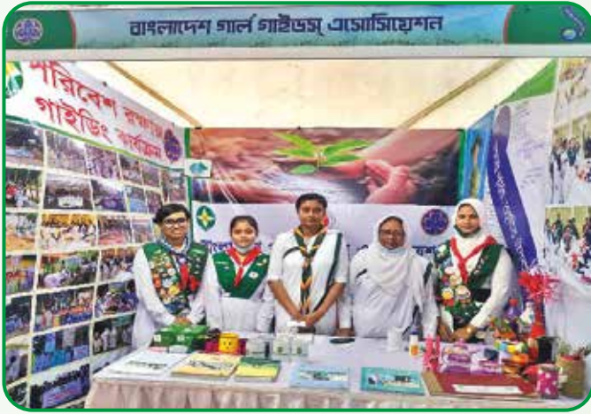
পরিবেশ মেলা ২০২২ রাজধানী অঞ্চলের অংশগ্রহণ