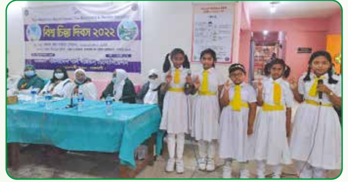
বিশ্ব চিন্তা দিবসে হলে পাখিদের প্রতিজ্ঞা নবায়ন

২২ ফেব্রুয়ারি, ২০২২ গাইড হাউজ, বিলসিমলা রাজশাহীতে বিশ্বচিন্তা দিবস পালিত হয়। বিশ্বের ১৫২টি দেশে এই দিনটিকে World Thinking Day হিসেবে পালন করা হয়।