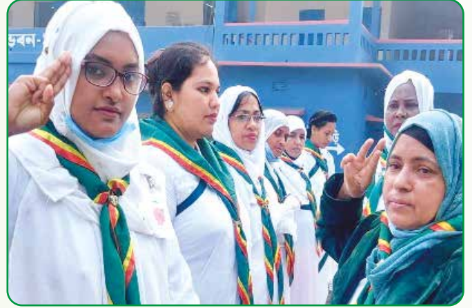
আঞ্চলিক কিশোরী সালাম গ্রহণ করছেন

প্রশিক্ষণে শিক্ষার্থীদের মা ও শিশুর ব্যক্তিগত স্বাস্থ্য, পরিচ্ছন্নতা ও পুষ্টি সাধন বিষয়ে আলোচনা হয়।