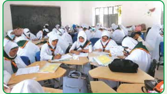
কালিয়াকৈর উপজেলায় গাইডারদের প্রশিক্ষণ