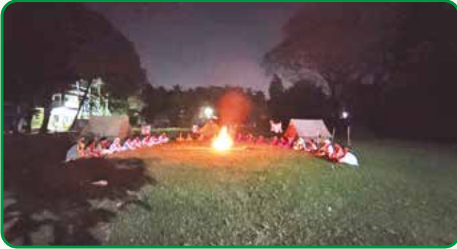
গভ: কলেজ অব অ্যাপ্রাইড হিউম্যান সাইন্স রেঞ্জার ইউনিটের ইউনিট ক্যাম্প ক্যাম্প ফায়ার

গাইড গাইডার মৌলিক প্রশিক্ষণ : কল্যাণপুর গার্লস স্কুল এন্ড কলেজ ঢাকায় অনুষ্ঠিত ২য় গাইড গাইডার মৌলিক প্রশিক্ষণের সমাপনী দিনে অংশগ্রহণকারী শিক্ষিকাদের মাঝে আঞ্চলিক কমিশনার, অতিরিক্ত আঞ্চলিক কমিশনার ও মিরপুর জেলা কমিশনার উপস্থিত ছিলেন।