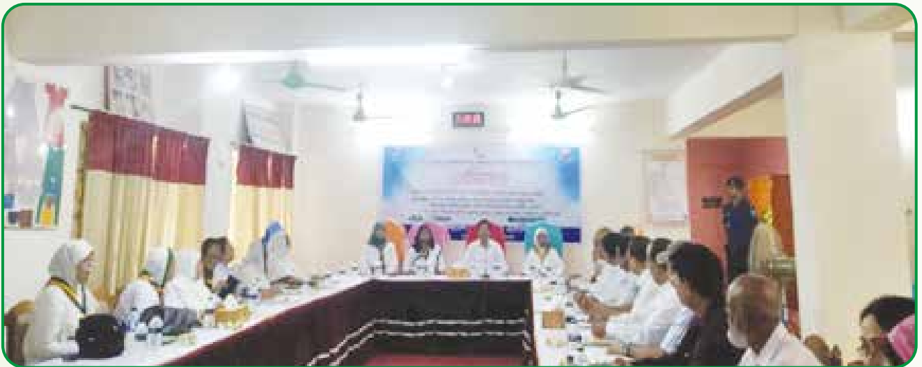
গাইডিং কার্যক্রম সম্প্রসারণের লক্ষ্যে রাজশাহী গাইড হাউজ বিলসিমলায় সেমিনার অনুষ্ঠিত