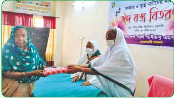
দুঃস্থ ও অসহায়ের মাঝে সহায়তা প্রদান

১৭ এপ্রিল রাজশাহী অঞ্চলের উদ্যোগে দুঃস্থ ও অসহায় নারীদের মাঝে ঈদ বস্ত্র বিতরণ করা হয়।