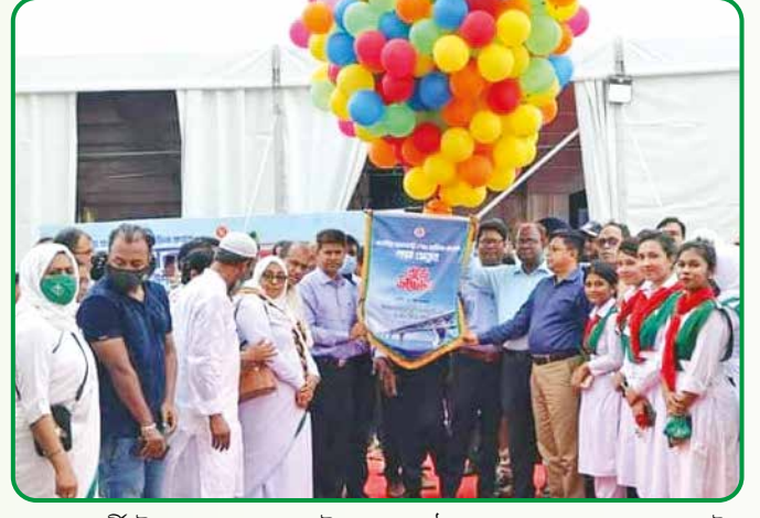
সোহরাওয়ার্দী উদ্যানে পদ্মা সেতুর উদ্বোধন অনুষ্ঠানে জেলা প্রশাসকের সাথে গাইড সদস্যবৃন্দ