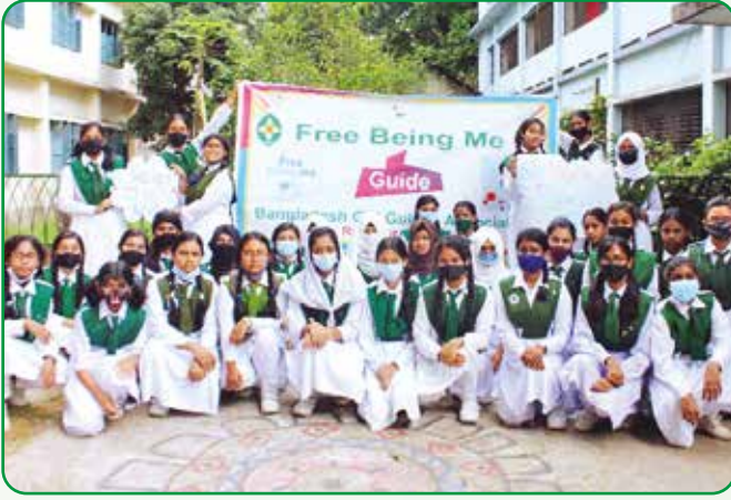
ফ্রি বিইং মি সেশনে ঠাকুরগাঁও জেলা সদরের গাইড দল