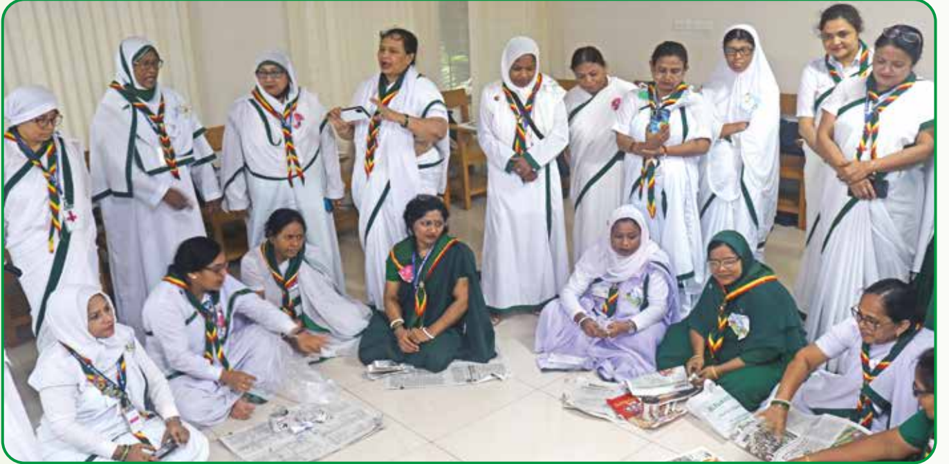
ওয়ারেন্ট গাইডার প্রশিক্ষণে প্রশিক্ষণরত গাইডারবৃন্দ