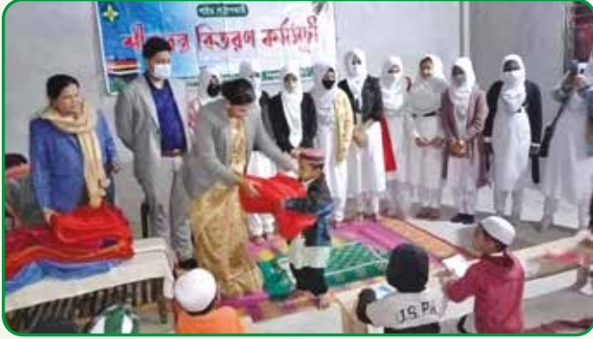
শিবপুর উপজেলায় দুস্তদের মাঝে শীত বস্ত্র বিতরণ

শীতবস্ত্র বিতরণ : জানুয়ারি, ২০২২ ঢাকা অঞ্চলের সকল জেলা এবং উপজেলায় দরিদ্র অসহায় দুঃস্থ মানুষের মাঝে শীতবস্ত্র বিতরণ করা হয়।