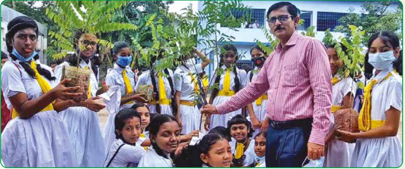
বৃক্ষরোপন কর্মসূচিতে হলদে পাখিদের সাথে জেলা শিক্ষা কর্মকর্তা অংশ নেন

পদ্মা সেতু উদ্বোধন উপলক্ষে আনন্দর্যাণী : পদ্মাসেতু উদ্বোধন উপলক্ষে ২৫ জুন আনন্দর্যাণীতে ময়মনসিংহ অঞ্চল এর সকল জেলা ও উপজেলার হলদে পাখি, গাইড, রেঞ্জার, গাইডার ও কমিশনারবৃন্দ অংশগ্রহণ করেন।