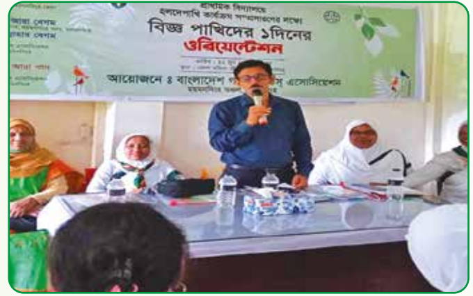
বিজ্ঞ পাখিদের ১ দিনের ওরিয়েন্টেশন, ময়মনসিংহ

হয়। ময়মনসিংহ জেলার সদর ও বিভিন্ন উপজেলা হতে আগত ২৫টি প্রাথমিক বিদ্যালয়ের ৪৫ জন প্রশিক্ষণার্থী অংশগ্রহণ করেন।