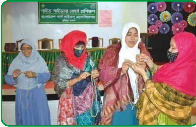
গাইড গাইডার মৌলিক প্রশিক্ষণ নিচ্ছেন অংশগ্রহণকারীবৃন্দ