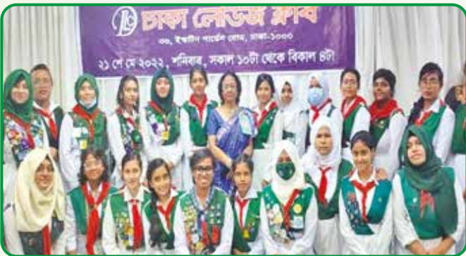
ঢাকা লেডিজ ক্লাবের দ্বি-বার্ষিক নির্বাচন সুষ্ঠুভাবে সম্পাদনের জন্য রাজধানী অঞ্চলের সার্ভিস প্রদানকারী রেঞ্জার সদস্যরা

সার্ভিস প্রদান : ২১ মে, ২০২২ ইস্কাটন গার্ডেন ঢাকা লেডিজ ক্লাবের দ্বি-বার্ষিক নির্বাচন অনুষ্ঠিত হয়। নির্বাচন সুষ্ঠুভাবে সম্পাদনের জন্য রাজধানী অঞ্চলের ২৫ জন রেঞ্জার সার্ভিস প্রদান করে।