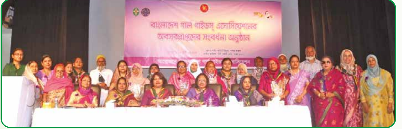
জাতীয় কমিশনার অবসরপ্রাপ্ত কর্মকর্তা কর্মচারীদের হাতে সম্মাননা ক্রেস্ট তুলে দেন

একই দিনে ইয়েস গার্লস্ মুভমেন্ট প্রকল্প কার্যক্রমের কক্ষ উদ্বোধন করেন জাতীয় কমিশনার। কবিতা আবৃত্তি, দলী সংগীত ও নৃত্য পরিবেশনের মধ্য দিয়ে অনুষ্ঠানের সমাপ্তি হয়।