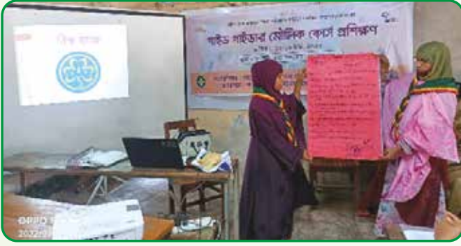
গাজীপুর জেলায় গাইড গাইডার মৌলিক প্রশিক্ষণ