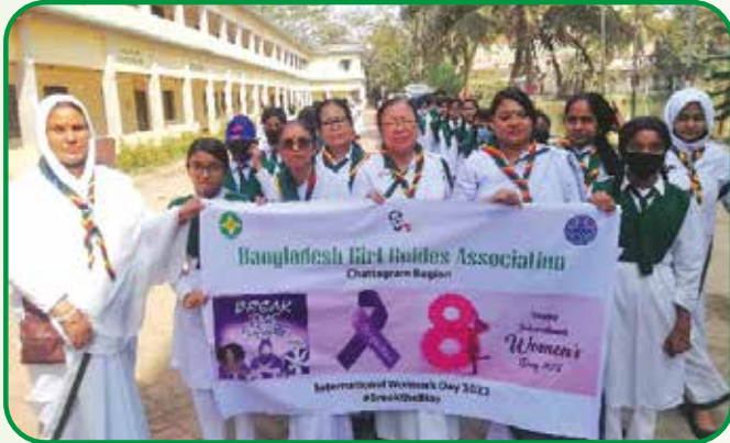
আন্তর্জাতিক নারী দিবস উপলক্ষে আঞ্চলিক কমিশনার সহ গাইড সদস্যরা শোভাযাত্রায় অংশগ্রহণ করে