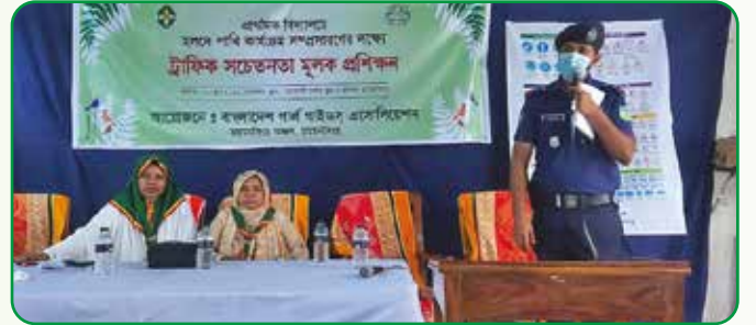
ট্রাফিক সচেতনতামূলক প্রশিক্ষণ