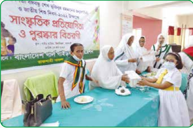
সাংস্কৃতিক প্রতিযোগিতায় অংশগ্রহণকারীদের মাঝে পুরস্কার বিতরণ

১৭ মার্চ, ২০২২ বাংলাদেশ গার্ল গাইডস এসোসিয়েশন, রাজশাহী অঞ্চলের উদ্যোগে গাইড হাউজ, বিলসিমলায় জাতির পিতার জন্ম বার্ষিকী ও জাতীয় শিশু দিবস উপলক্ষে হলদে পাখিদের অংশগ্রহণে সাংস্কৃতিক প্রতিযোগিতা, যেমন: গান, নৃত্য, কবিতা আবৃত্তি, ছড়া ইত্যাদি অনুষ্ঠিত হয়। উক্ত অনুষ্ঠানে ১০০ জন হলদে পাখি অংশগ্রহণ করে।