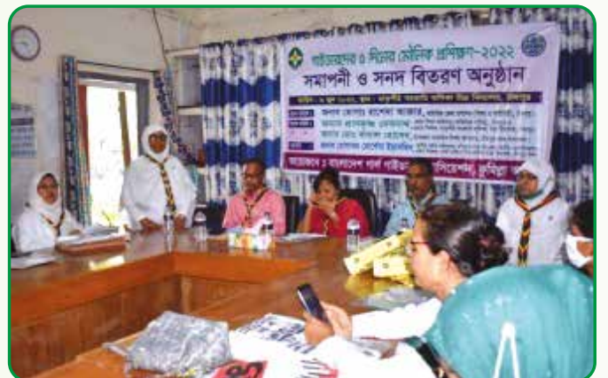
গাইড গাইডার কোর্স প্রশিক্ষণ, মাতৃপীঠ সরকারি বালিকা উচ্চ বিদ্যালয়