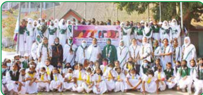
৮ মার্চ বিশ্ব নারী দিবস পালনে অংশগ্রহণ করে হলেদে পাখি, গাইড, রেঞ্জার, গাইডার ও কমিশনারবৃন্দ

নীলফামারী জেলা এসোসিয়েশন আয়োজিত নারী দিবসের র্যালীতে গাইড, গাইডার ও কমিশনারবৃন্দ অংশগ্রহণ করে।