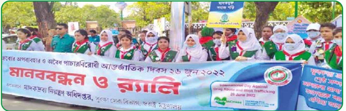
মাদকদ্রব্যের অপব্যবহার ও অবৈধ পাচারবিরোধী আন্তর্জাতিক দিবস উপলক্ষে মানববন্ধন ও র্যালিতে অংশগ্রহণকারী রেঞ্জারদের একাংশ