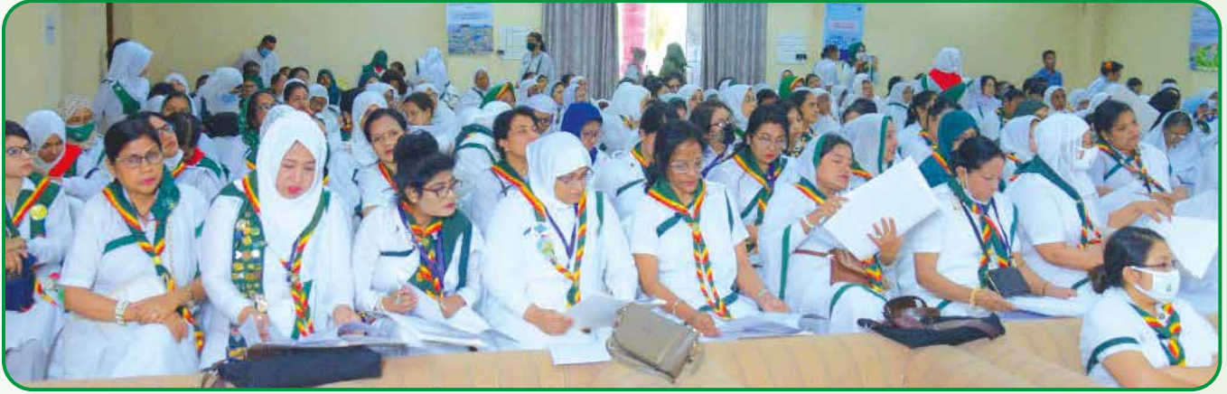
৪৩ তম জাতীয় পরিষদ অধিবেশনে অংশগ্রহণকারী কাউন্সিলরবৃন্দ