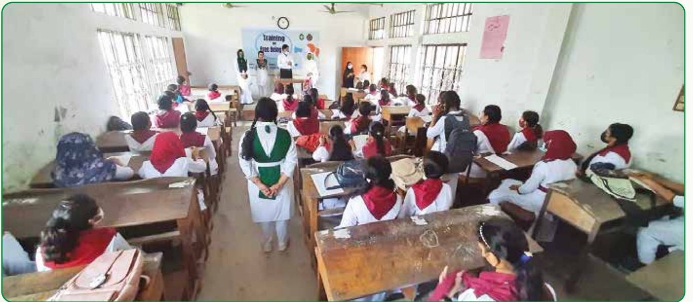
Free Being Me সেশন

Free Being Me সেশন : ২৭ ফেব্রুয়ারি খুলনা কলেজিয়েট গার্লস স্কুল এন্ড কে.সি.সি উইমেন্স কলেজে ২৫০ জন গাইড সদস্যকে Free