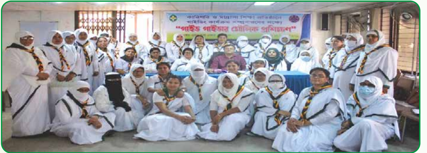
আঞ্চলিক কার্যালয়, গাইড হাউজ, ঢাকায় অনুষ্ঠিত ১ম গাইড গাইডার মৌলিক প্রশিক্ষণের সমাপনী অনুষ্ঠানের প্রধান অতিথির সাথে অংশগ্রহণকারী শিক্ষিকাবৃন্দ