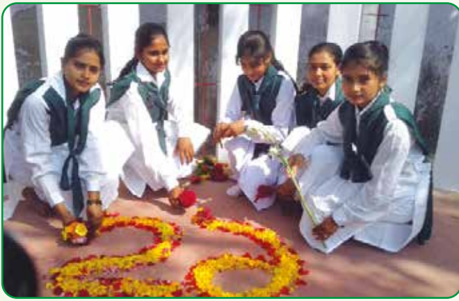
শহীদ মিনারে বিশেষ চাহিদা সম্পন্ন শিশুদের পুষ্পস্তবক অর্পন

২১ ফেব্রুয়ারি, ২০২২ শহীদ দিবস ও আন্তর্জাতিক মাতৃভাষা দিবস উপলক্ষে রাজশাহী অঞ্চলে পুষ্পস্তবক অর্পন, হলে পাখি, গাইড, রেঞ্জারদের মাঝে চিত্রাংকন, কবিতা আবৃত্তি ও রচনা প্রতিযোগিতা, আলোচনা সভা অনুষ্ঠিত হয়।