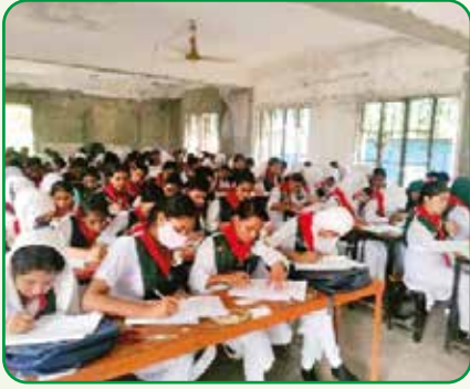
ইনভেস্টিগেটর প্রশিক্ষণ, নারায়ণগঞ্জ