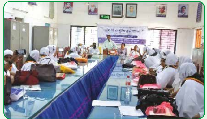
মৌলিক প্রশিক্ষণ ফরিদপুর জেলা