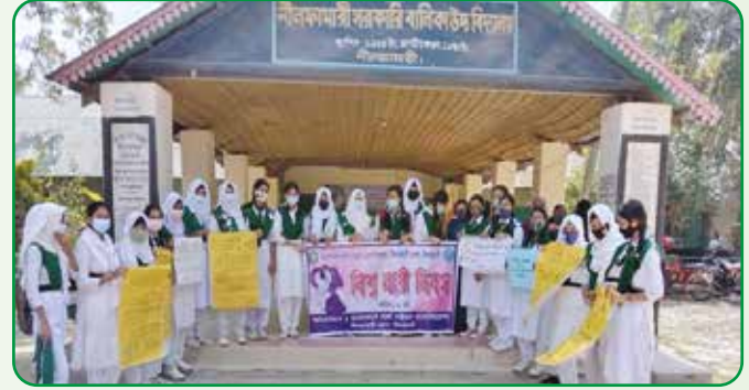
৮ মার্চ বিশ্ব নারী দিবস পালন করে নীলফামারী জেলা সদরের নীলফামারী সরকারি বালিকা উচ্চ বিদ্যালয়ের গাইড দল

নীলফামারী জেলা এসোসিয়েশন আয়োজিত নারী দিবসের র্যালীতে গাইড, গাইডার ও কমিশনারবৃন্দ অংশগ্রহণ করে।