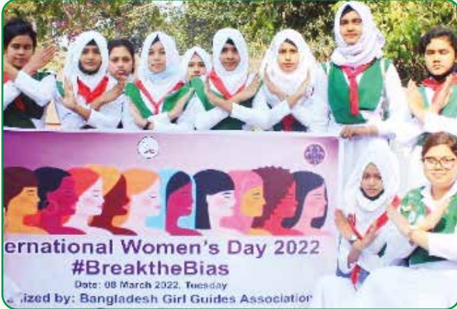
“Break The Bias” এই প্রতিপাদ্য বিষয়ের সাথে সংহতি রেখে রংপুর অঞ্চলের বিশ্ব নারী দিবসের র্যালীতে অংশগ্রহণকারী রেঞ্জারবৃন্দ

বিশ্ব নারী দিবস : ৮ মার্চ, ২০২২ “Break The Bias” এই শ্লোগান কে সামনে রেখে উদযাপন করা হয় বিশ্ব নারী দিবস। রংপুর অঞ্চল আয়োজিত র্যালীতে হলেদে পাখি, গাইড, রেঞ্জার, গাইডার, কমিশনার, ট্রেনারসহ ১৫০ জন অংশগ্রহণ করেন।