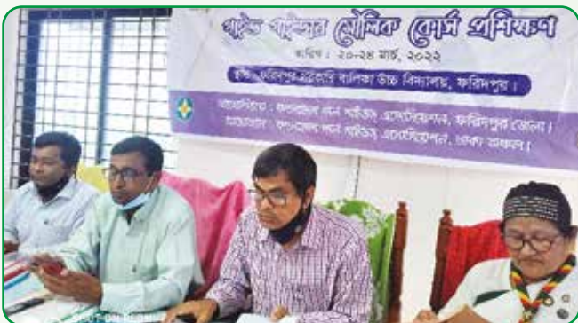
মৌলিক প্রশিক্ষণ ফরিদপুর জেলা