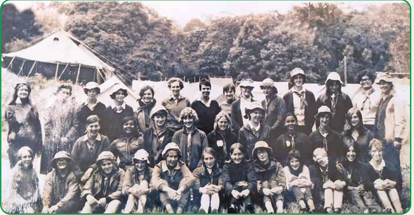
ক্যাম্প সাউদার্ন ক্রস এরিডেনাস প্রি আমার পেট্রোল আমি মাঝের সারিতে ডান দিক হতে তৃতীয়