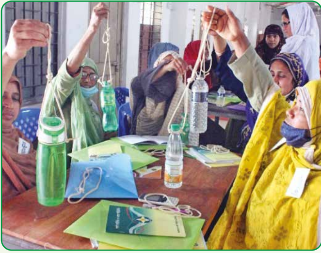
ইবতেদায়ী শাখার বিজ্ঞ পাখি মৌলিক প্রশিক্ষণে টেভাফুট গিরা শিখছে প্রশিক্ষণার্থীরা

১২ হতে ১৬ মার্চ, ২০২২ রংপুর সরকারি বালিকা উচ্চ বিদ্যালয়ে কারিগরি ও মাদ্রাসা শিক্ষা প্রতিষ্ঠানে গাইডিং সম্প্রসারণ প্রকল্পের অধীনে ৫ দিনব্যাপী বিজ্ঞ পাখি মৌলিক প্রশিক্ষণ অনুষ্ঠিত হয়। রংপুর জেলার ৮ টি উপজেলা থেকে ৪০ টি মাদ্রাসার ইবতেদায়ী শাখার ৪০ জন সহকারী