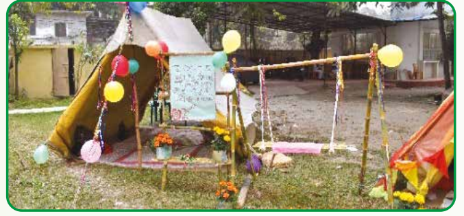
তাবু বাসির অভিজ্ঞতা