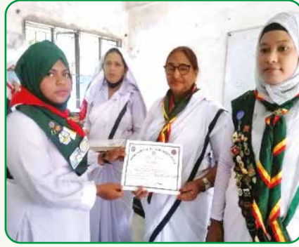
নারায়ণগঞ্জ জেলায় প্রশিক্ষণ শেষে রেঞ্জারদের সার্টিফিকেট প্রদান