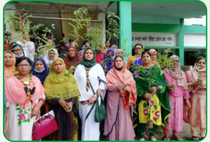
প্রাথমিক বিদ্যালয়ে গাইডিং কার্যক্রম সম্প্রসারণের লক্ষ্যে হাটহাজারি জেলায় বৃক্ষরোপন কর্মসূচি পালন