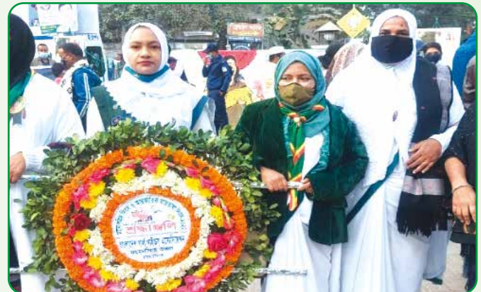
শহীদ মিনারে পুষ্প স্তবক অর্পন

২১ ফেব্রুয়ারি উদযাপন : আন্তর্জাতিক মাতৃভাষা দিবসে ময়মনসিংহ অঞ্চলের গাইড, গাইডার ও কমিশনারগণ প্রভাত ফেরীর অংশগ্রহণ ও শহীদ মিনারে পুষ্প স্তবক অর্পনের মধ্যে দিয়ে শহীদের প্রতি বিনম্র শ্রদ্ধা প্রদর্শন করেন। অন্যান্য জেলা ও উপজেলা সমূহে যথাযথ নিয়মে আন্তর্জাতিক মাতৃভাষা দিবস পালন করা হয়।