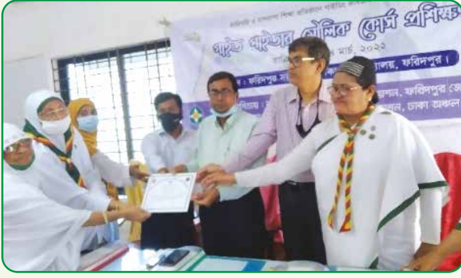
মৌলিক প্রশিক্ষণে অংশগ্রহণকারীদের মাঝে সনদ বিতরণ