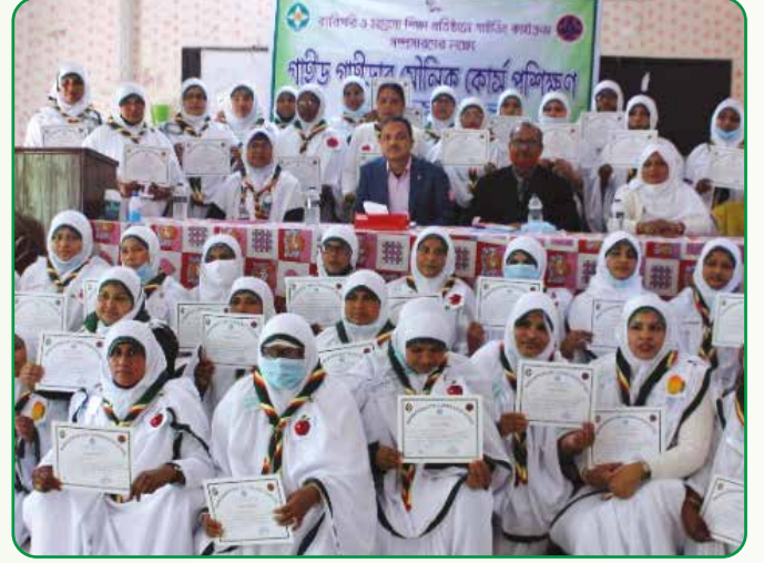
গাইড গাইডার মৌলিক প্রশিক্ষণ শেষে সনদ হাতে অংশগ্রহণকারীবৃন্দ