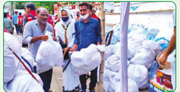
সীতাকুন্ড উপজেলায় অগ্নিদগ্ধ পরিবারের মাঝে দ্রানসামগ্রী বিতরণ করা হয়

দ্রাণ সামগ্রী বিতরণ : ৬ জুন, ২০২২ সীতাকুন্ড উপজেলায় অগ্নিদগ্ধ ৫০ টি পরিবারের মাঝে আঞ্চলিক তহবিল হতে দ্রানসামগ্রী প্রশাসন চট্টগ্রাম এর মাধ্যমে বিতরণ করা হয়।