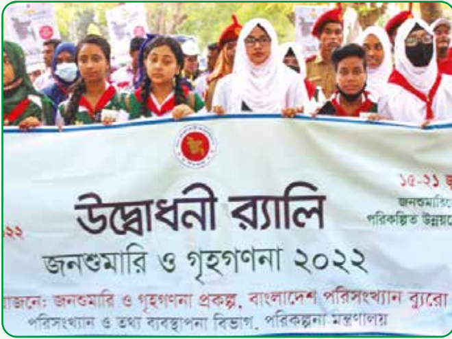
জনশুমারি র্যালিতে রেঞ্জারদের অংশগ্রহণ

১৫ জুন, ২০২২ বাংলাদেশ পরিসংখ্যান ব্যুরোর আওতায় ৬ষ্ঠ জনশুমারি র্যালী রাজশাহী বিভাগীয় কমিশনারের কার্যালয় হতে সি এন্ড বি মোড় পর্যন্ত অনুষ্ঠিত হয়। র্যালীতে ২০ জন রেঞ্জার অংশগ্রহণ করে।