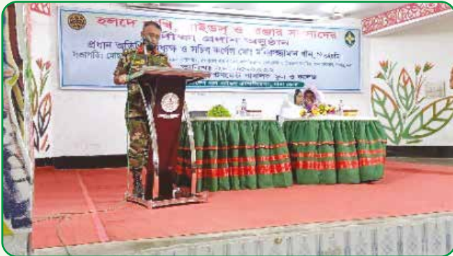
সাভার ক্যান্টনমেন্ট বালিক স্কুল এন্ড কলেজে দীক্ষা দান

রোজার পরবর্তী সময়ে ২টি উপজেলায় গাইড গাইডার বেসিক কোর্স প্রশিক্ষণের প্রয়োজনীয় ব্যবস্থা গ্রহণের সিদ্ধান্ত গৃহীত হয় এবং গার্ল গাইডস কোম্পানী বা দল খোলা ও গাইডিং কার্যক্রম সম্প্রসারণ করার