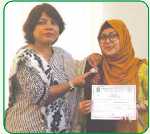
৩৭ তম বিশ্ব সম্মেলনে অংশগ্রহণকারী জাতীয় রেঞ্জার কাউন্সিলের চেয়ারম্যানের হাতে সনদ তুলে দেন জাতীয় কমিশনার