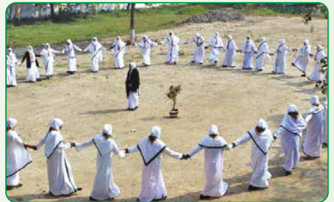
প্রশিক্ষণরত বিজ্ঞ পাখি