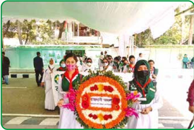
ধানমন্ডি ৩২ নম্বরে বঙ্গবন্ধুর প্রতিকৃতিতে পুষ্পস্তবক অর্পণ

সভা সমাবেশ : ৩, ৯, ১৩ ও ২৩ ফেব্রুয়ারি, ২০২২ রাজধানী অঞ্চলের কার্যক্রম নিয়ে বাংলাদেশ টেলিভিশনে 'আলোর বর্ণাধারা' অনুষ্ঠান বাস্তবায়ন সাব-কমিটির সভা অনুষ্ঠিত হয়। ২৮ ফেব্রুয়ারি 'বিশ্ব ভোক্তা অধিকার দিবস ২০২২' উদযাপন উপলক্ষে জাতীয় ভোক্তা-অধিকার