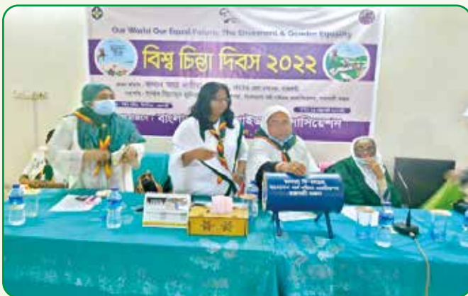
বিশ্ব চিন্তা দিবসে তহবিল সংগ্রহ

২১ ফেব্রুয়ারি, ২০২২ শহীদ দিবস ও আন্তর্জাতিক মাতৃভাষা দিবস উপলক্ষে বিশেষ চাহিদা সম্পন্ন গাইড ছাত্রীরা শহীদ মিনারে পুষ্পস্তবক অর্পন করেন।